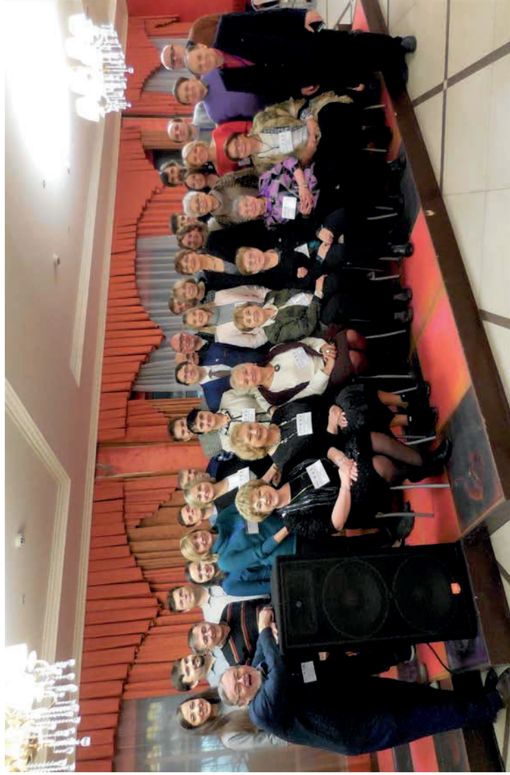
Международная научно-образовательная конференция «Всеобщая история и историческая наука в XX – начале XXI века». Казань. 14–16 ноября 2019 г.