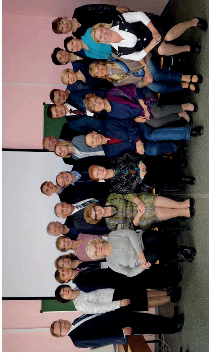
Международная научно-практическая конференция «Парадигмы университетской истории и перспективы университетологии (к 50-летию Чувашского государственного университета имени И.Н. Ульянова)». VII Арсентьевские чтения. Чебоксары. 12–14 октября 2017 г.