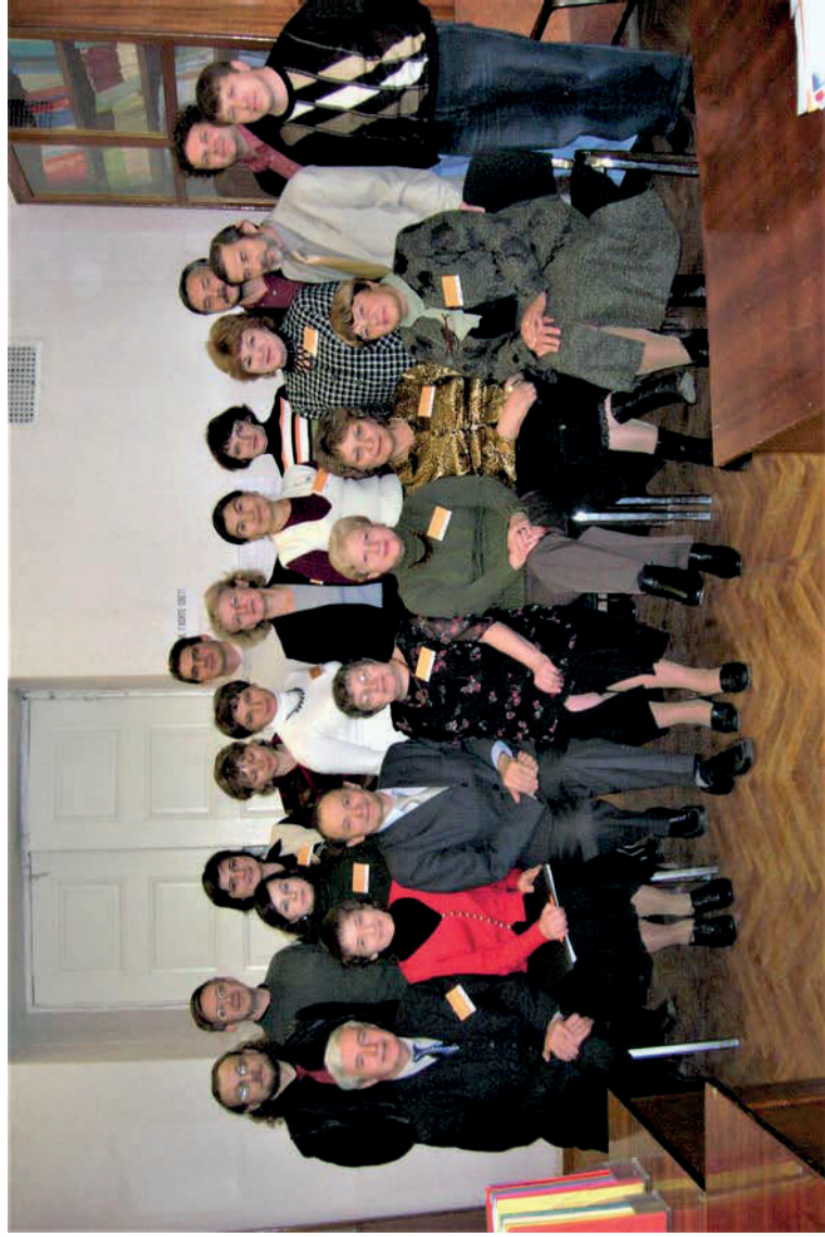
Всероссийская научная конференция «Политические и интеллектуальные сообщества в сравнительной перспективе». Пермь. 22-23 сентября 2007 г.