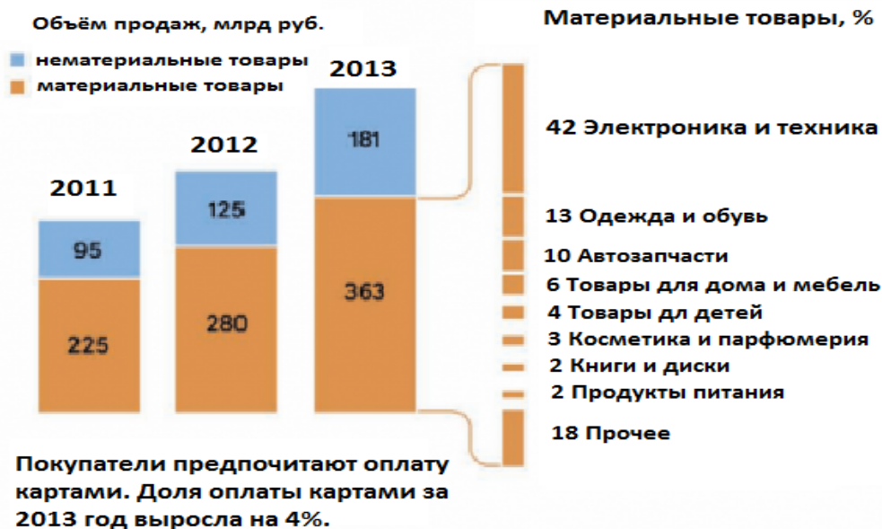
Рисунок 2. Статистика покупок в сети интернет в 2011–2013 гг.

Интернет облегчил работу, как продавцам, так и покупателям. Теперь, чтобы привлечь больше клиентов в ваш магазин, нужно просто сделать хороший сайт. Раньше же нужно было развесить баннеры по всему городу, делать «холодные звонки» и так далее. Теперь покупатель просто вводит необходимый ему товар в поисковую систему, и ему на выбор выходит целый список компаний, которые могут удовлетворить его запросам.