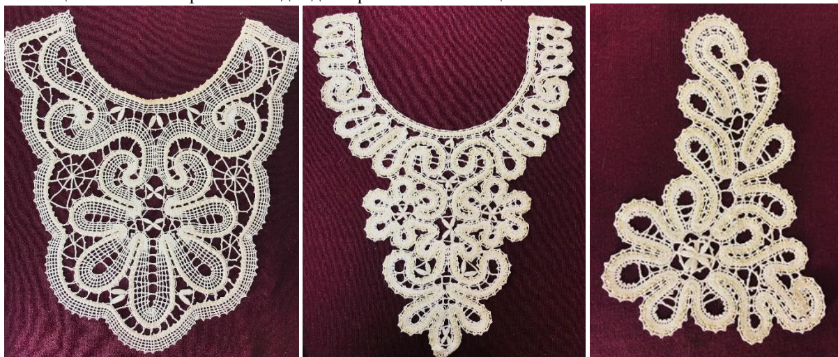
Рисунок 2 – Декоративные элементы из кружева (автор Калачева Е.В.)

– порте» из современных материалов с использованием эстетически выразительных элементов вологодского кружева. Целью разработки данной коллекции являлось показать возможность использования народных, и возрождение духовных, традиций в современном костюме. На рисунке 2 представлены фотографии декоративных элементов из кружева использованных в коллекции «Наследие Вологды», а на рисунке 3 представлен коллаж данной коллекции.