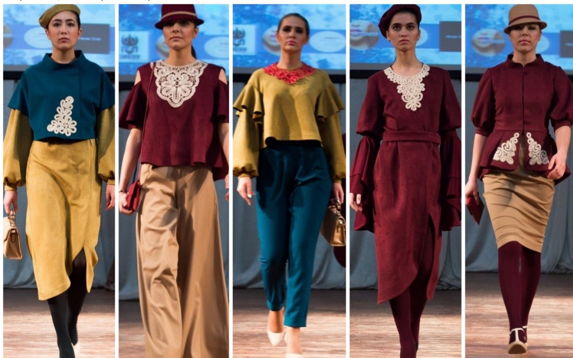
Рисунок 3 – Коллекция «Наследие Вологды». Авторы Калачева Е.В., Одицова А.Д.

между собой. Использование глубоко матовых, гладких поверхностей подчеркивает благородство и изящество элементов вологодского кружева. Также, в архитектонике костюма все пластические линии были увязаны с узорами элементов кружева.