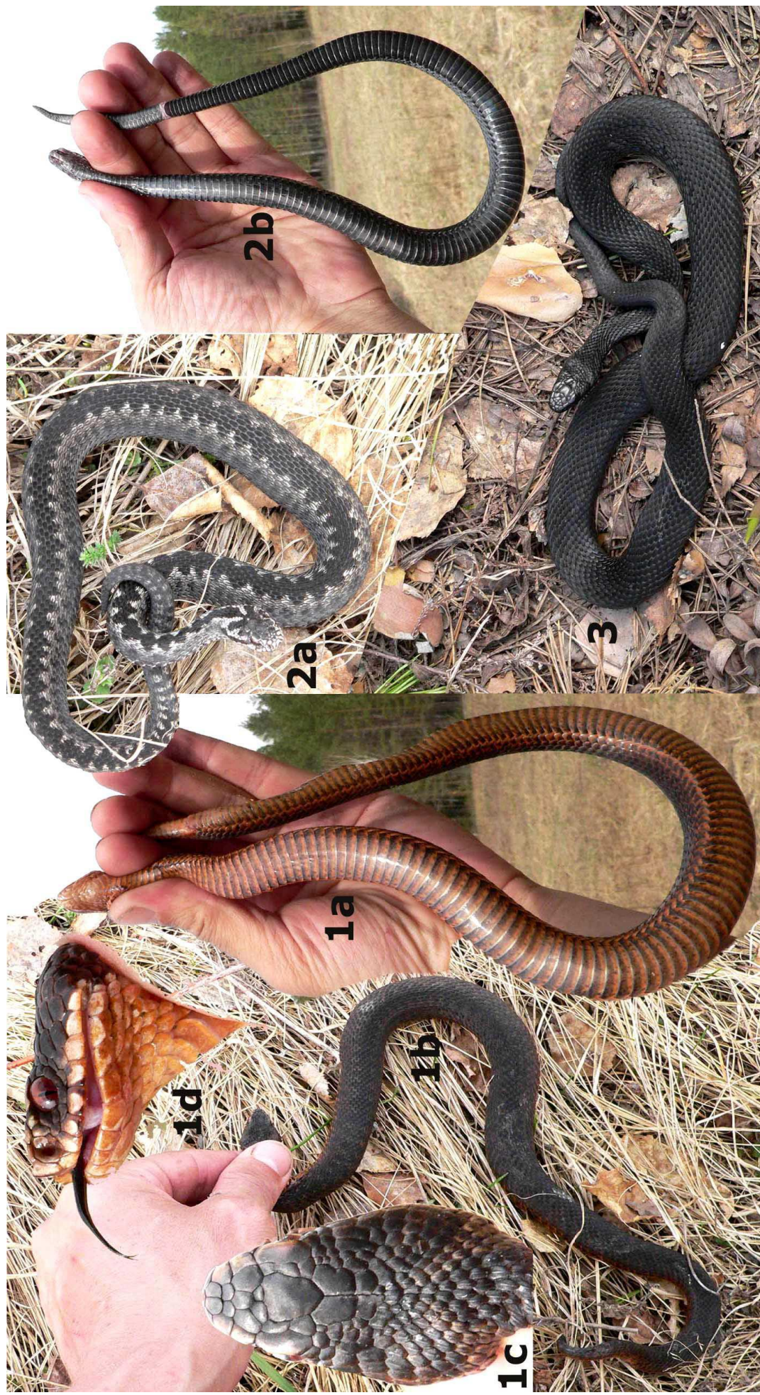
Рис. 1. Варианты окраски обыкновенной гадюки с территории заповедника «Большая Кокшага». 1а, 1б – вид с брюшной и спинной сторон, темно-бурый самец; 1с – дорзальная и 1д – латеральная проекция головы той же особи; 2а, 2б – криптически окрашенный самец; 3 – гадюка-меланист.