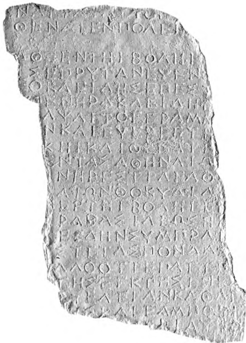
VIII. Фрагменты афинского декрета в честь Гераклида Клазоменского