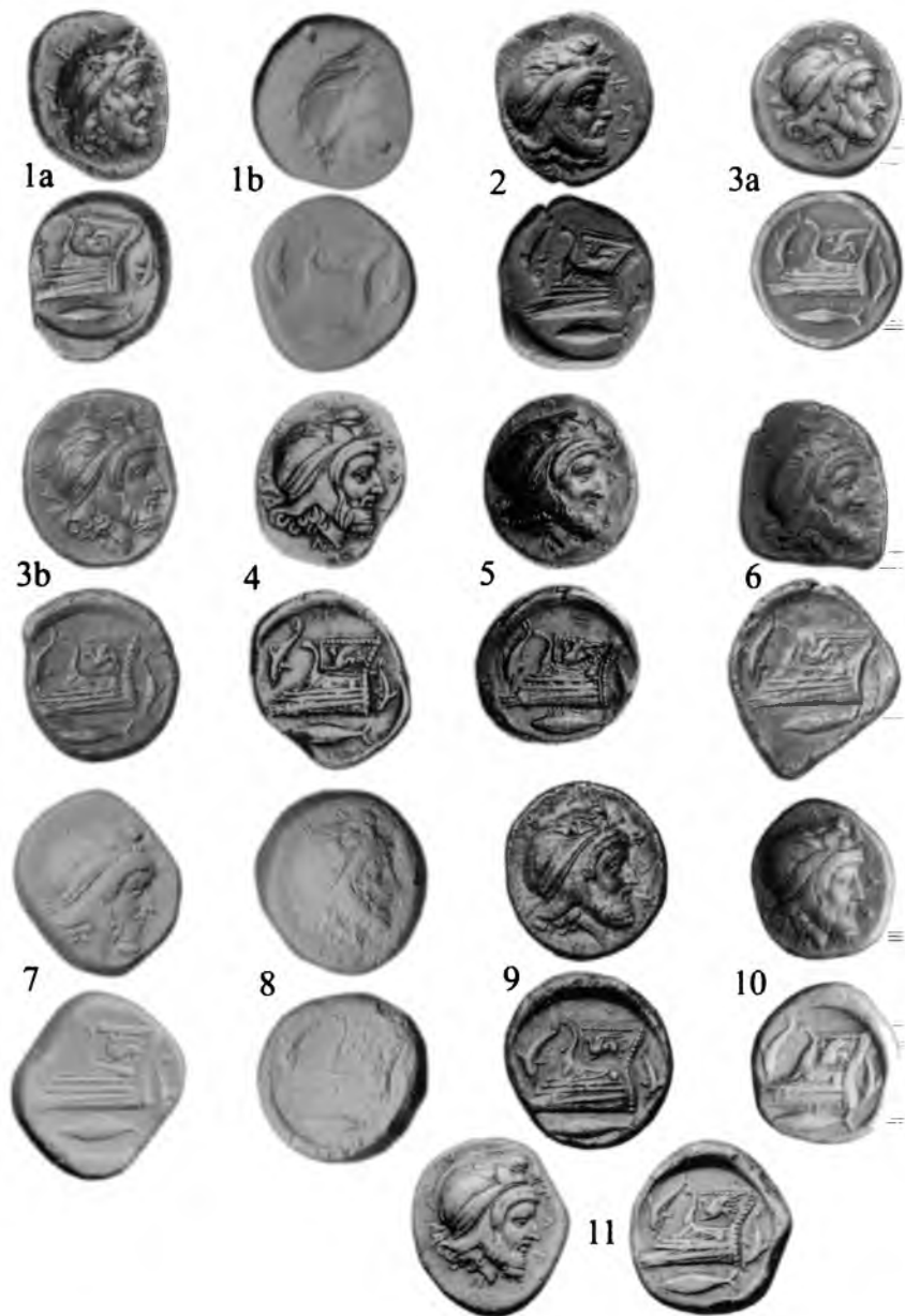
ХII. Тетрадрахмы Фарнабаза. г. Кизик