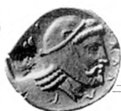
IV. 1. Статер Фарнабаза. г.Тарс (Киликия) 2. Статер Фарнабаза. г.Тарс (Киликия) 3. Статер Тирибаза. г. Маллы (Кария)