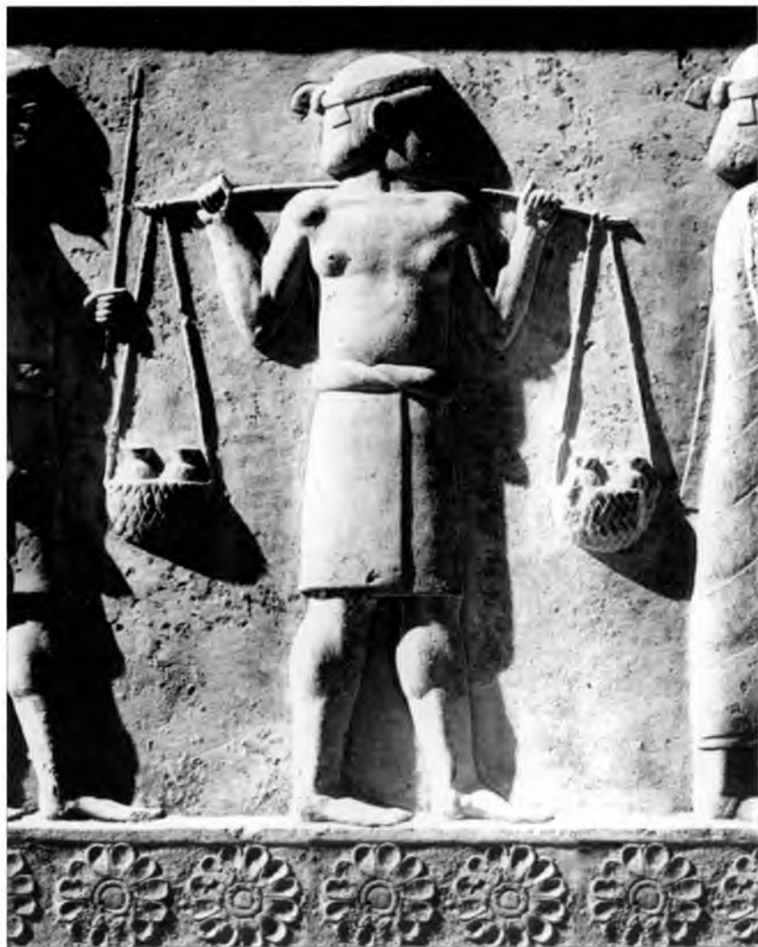
X. Представитель чужеземной делегации, приносящей дары персидскому царю Дарию I (возможно землю и воду). Рельефы тронного зала (ападаны) из Персеполя