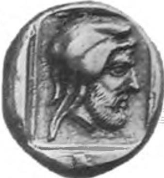
III. 1. Тетрадрахма Фарнабаза. г. Кизик 2. Тетрадрахма Фарнабаза. г. Кизик 3. Гекте из электра Фарнабаза. г. Митилена (о. Лесбос)