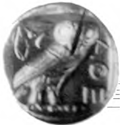
VI. 1. Тетрадрахма Кира Младшего. г. Сарды 2. Тетрадрахма Кира Младшего. г. Сарды