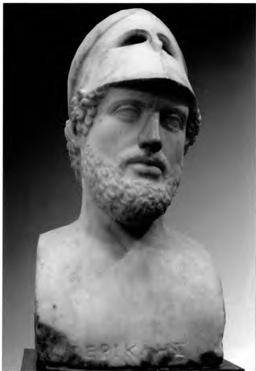
IX. Перикл. Сын Кеантиппа