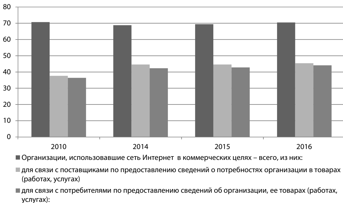
Рис. 2. Использование сети Интернет для связи с поставщиками и потребителями товаров (работ и услуг), % (Российский статистический ежегодник. 2017: стат. сб./ Росстат. М., 2017. С. 459)

Анализ накопленного в России опыта использования цифровых технологий позволил выявить и идентифицировать существующие разрывы между настоящим качеством человеческого капитала и современными вызовами цифровой среды принятия управленческих решений. В Программе «Цифровая экономика Российской Федерации» отмечены следующие разрывы. При достаточно высокой позиции России по уровню развития человеческого ка-