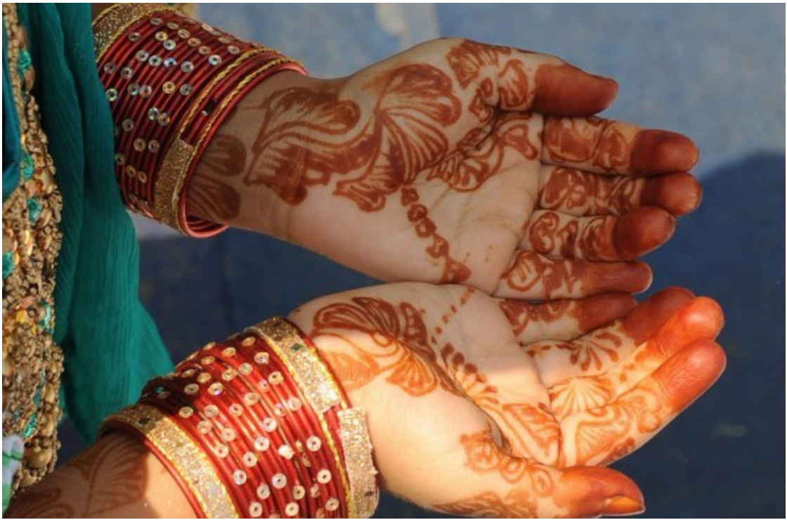
Индийская мусульманка. Ид аль-Фитр. Хайдарабад, Индия.