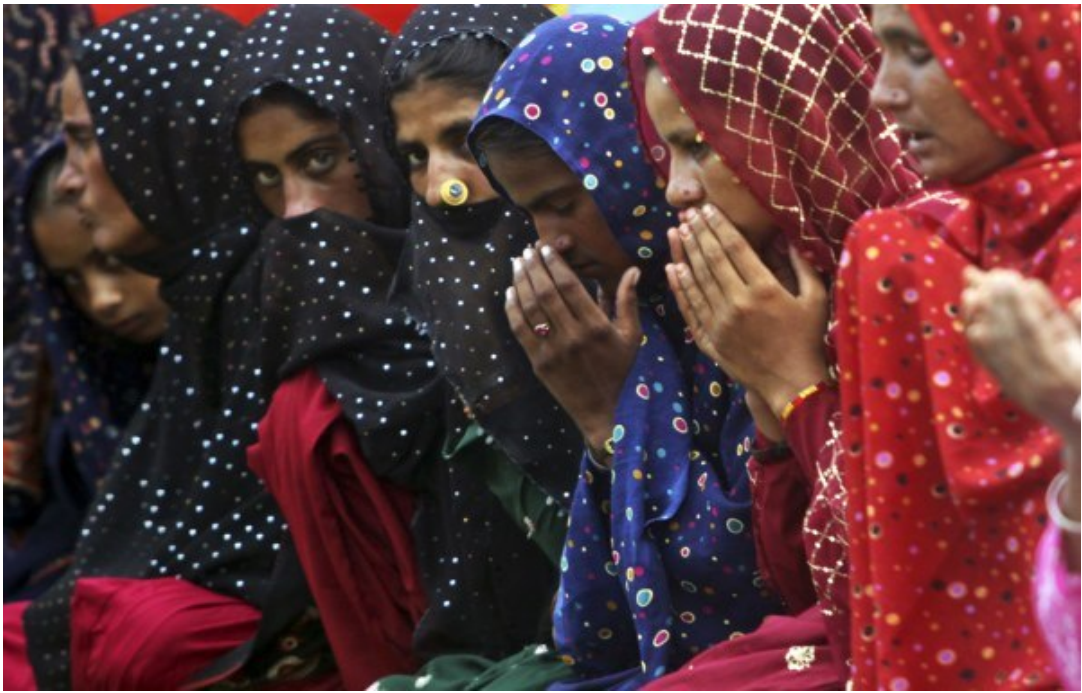
Мусульманки во время молитвы на Ид аль-Фитр. Джамму, Индия.