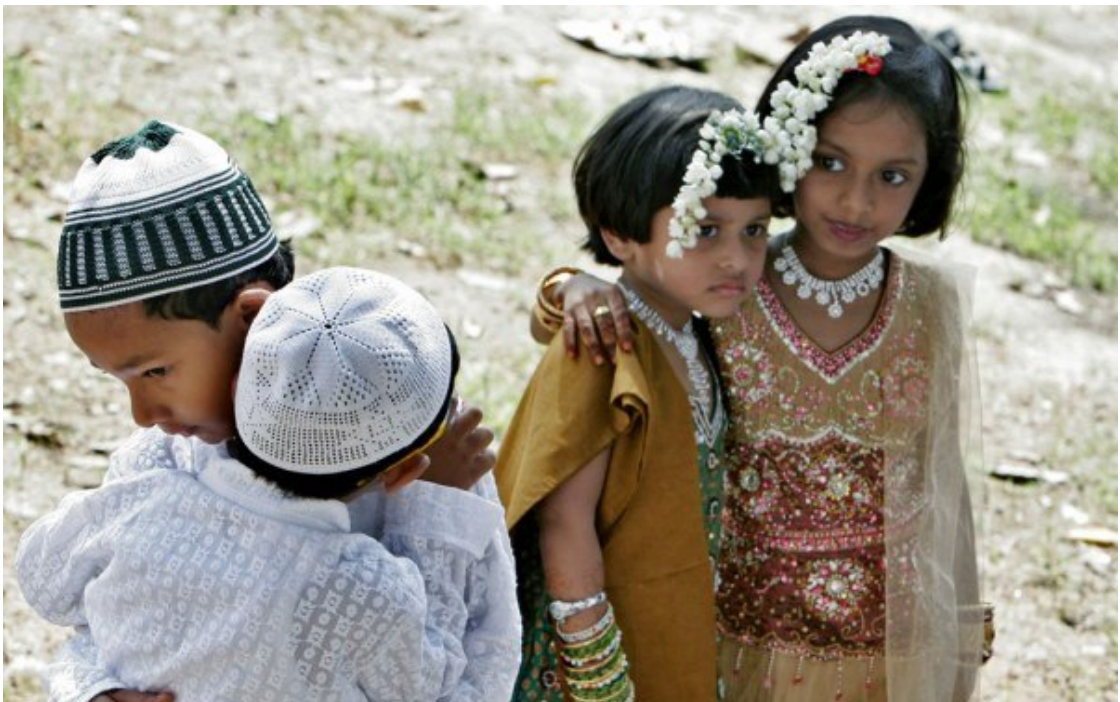
Индийские мальчики и девочки мусульмане. Бангалор, Индия.