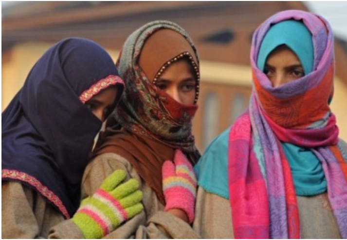
Кашмирские мусульманки. Сринагар, Индия.