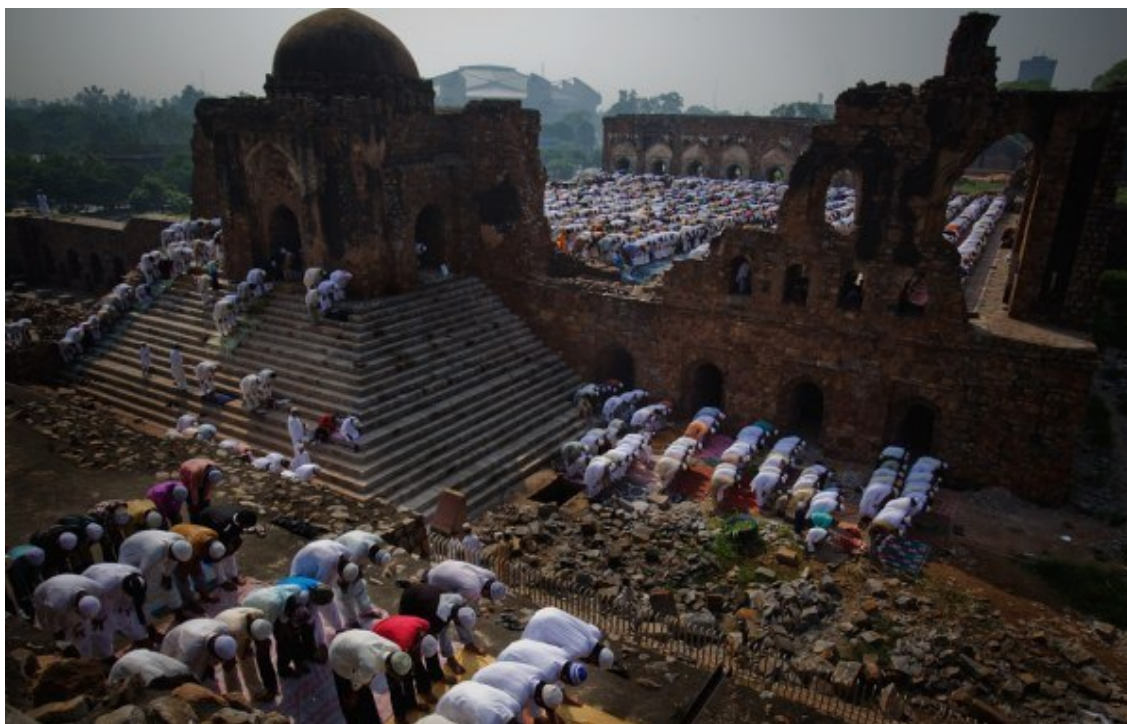
Индийские мусульмане молятся в мечети Фероз Шах Котла. Нью-Дели, Индия.

Фотографии сделаны во время праздников в Индии.