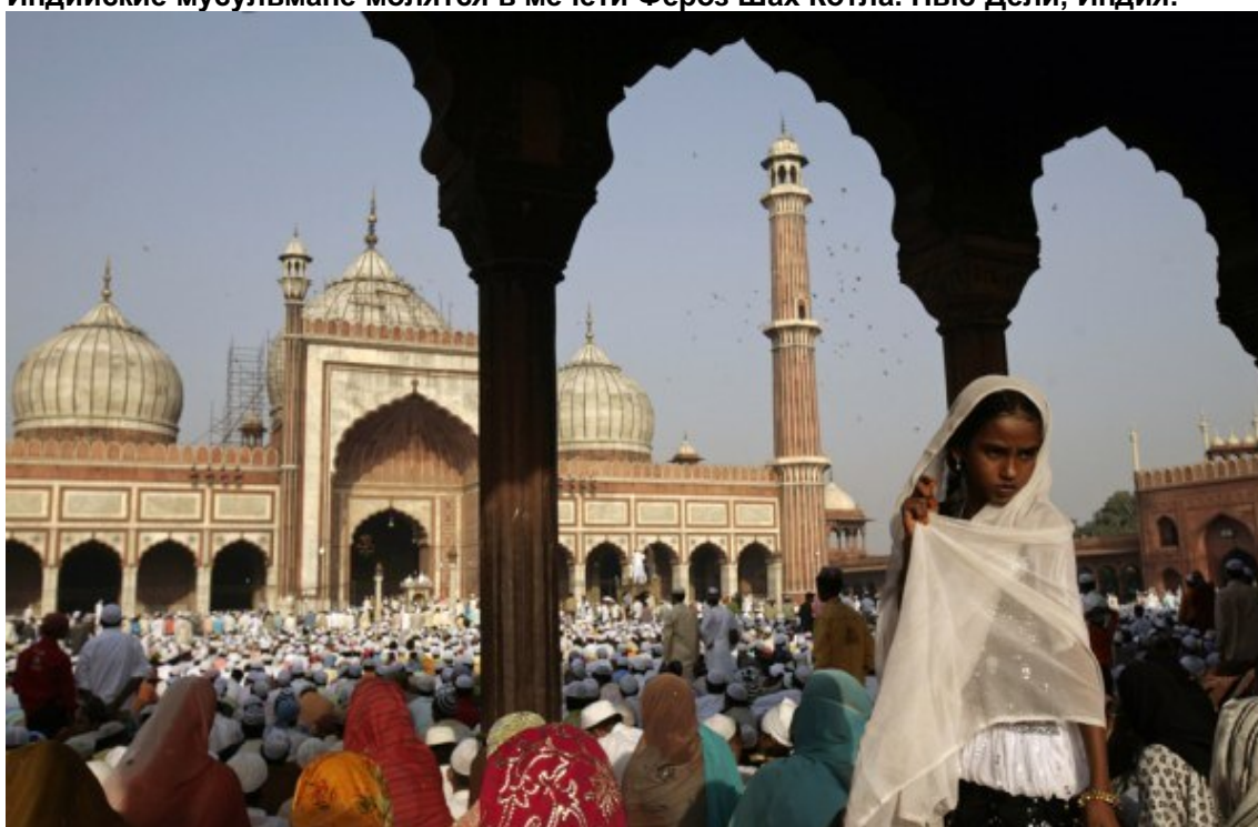
Мусульманские женщины готовятся к молитве в мечети Джама Масджид. Дели, Индия.