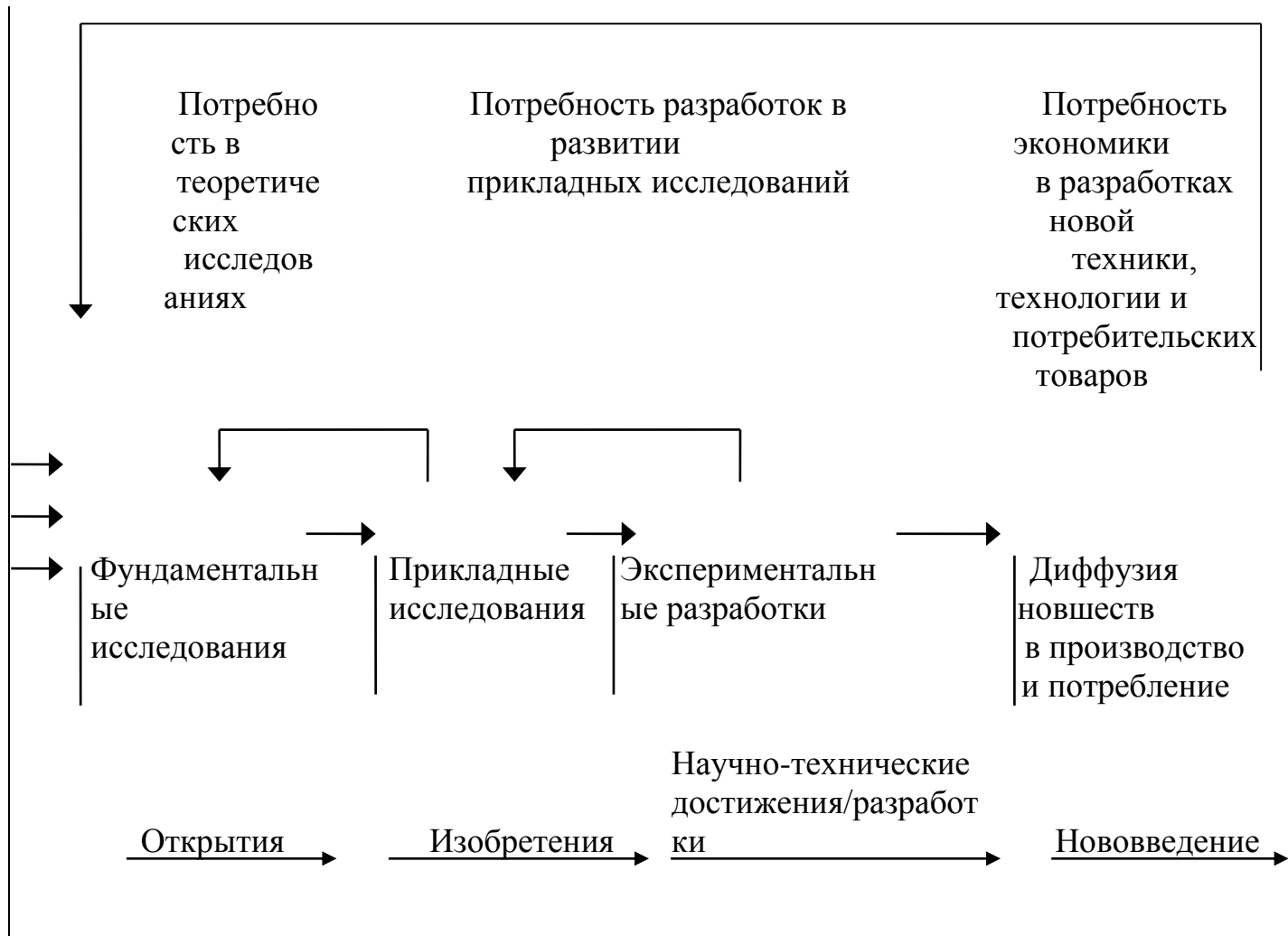
Рисунок: Жизненный цикл нового продукта