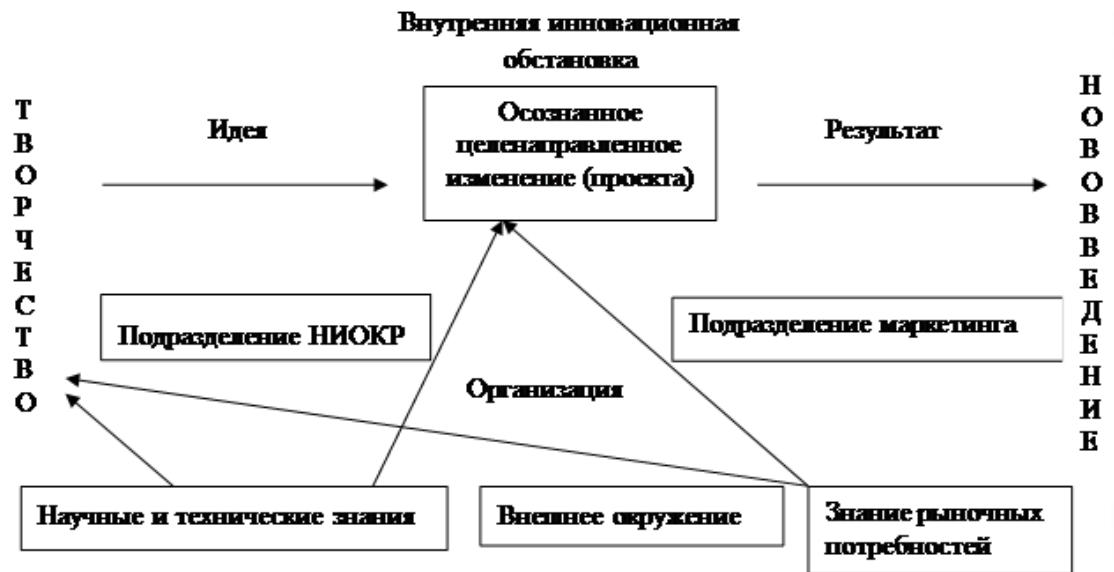
Рисунок - Нововведение как результат сложных взаимодействий

Предмет изучения инновационного менеджмента - целенаправленные процессы создания, освоения и распространения нововведений и обусловленные ими изменения в социальных, экономических и технических системах.