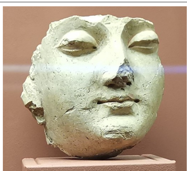
Рис. 2. Фрагмент головы Будды (Хадда, II-III в.н.э.).