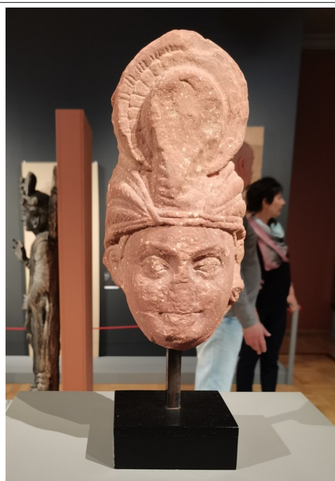
Рис. 3. Голова бодхисатвы (Матхура, I-II в. н.э.)