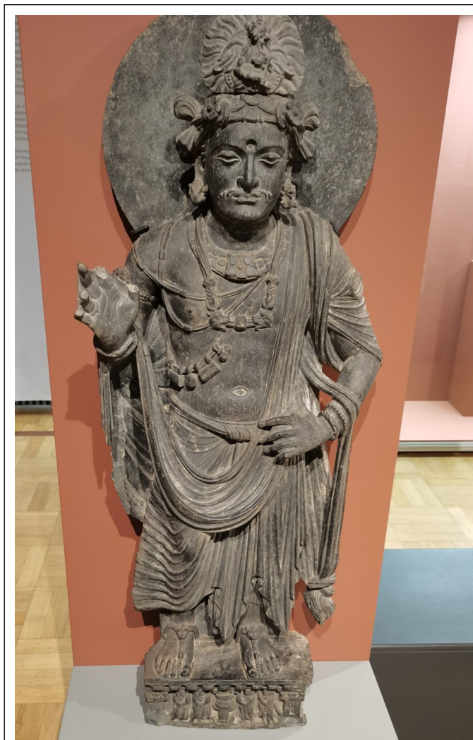
Рис. 4. Стоящий бодхисатва в тюрбане (Гандхара, нач. III в. н.э.)