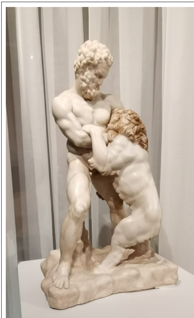
Рис. 5. Геракл, борющийся со львом (Рим, II-III в. н.э.)

будут интересны детям. На фоне рассказывается история Александра Македонского и его войска, а в отдельном зале можно послушать лекцию.