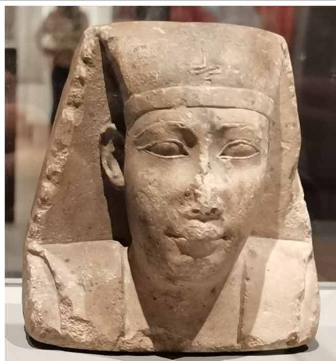
Рис. 7. Голова одного из Птолемеев (III-I вв. до н.э.).

С научной точки зрения выставка как цельное произведение имеет, конечно, нулевую ценность, хотя отдельно взятые экспонаты, безусловно, интересны.