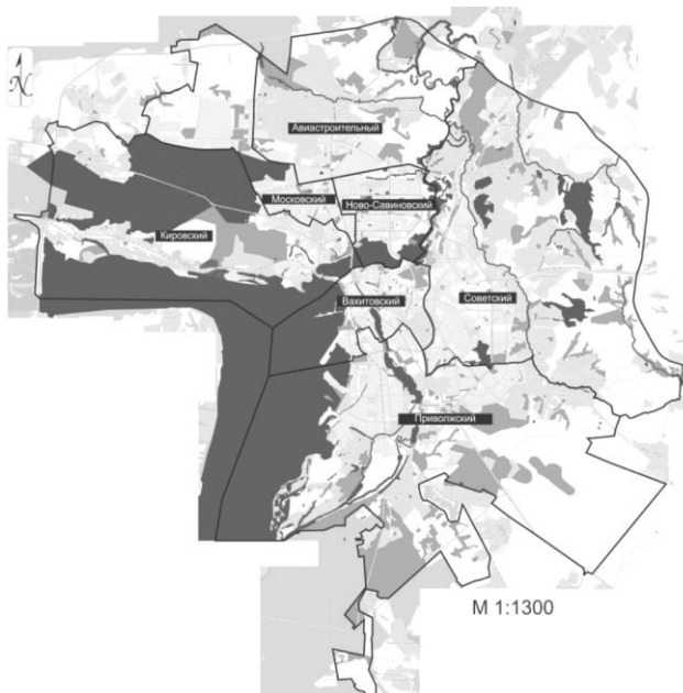
Рис.1 Элементы экологического каркаса Приволжского р-на г. Казань