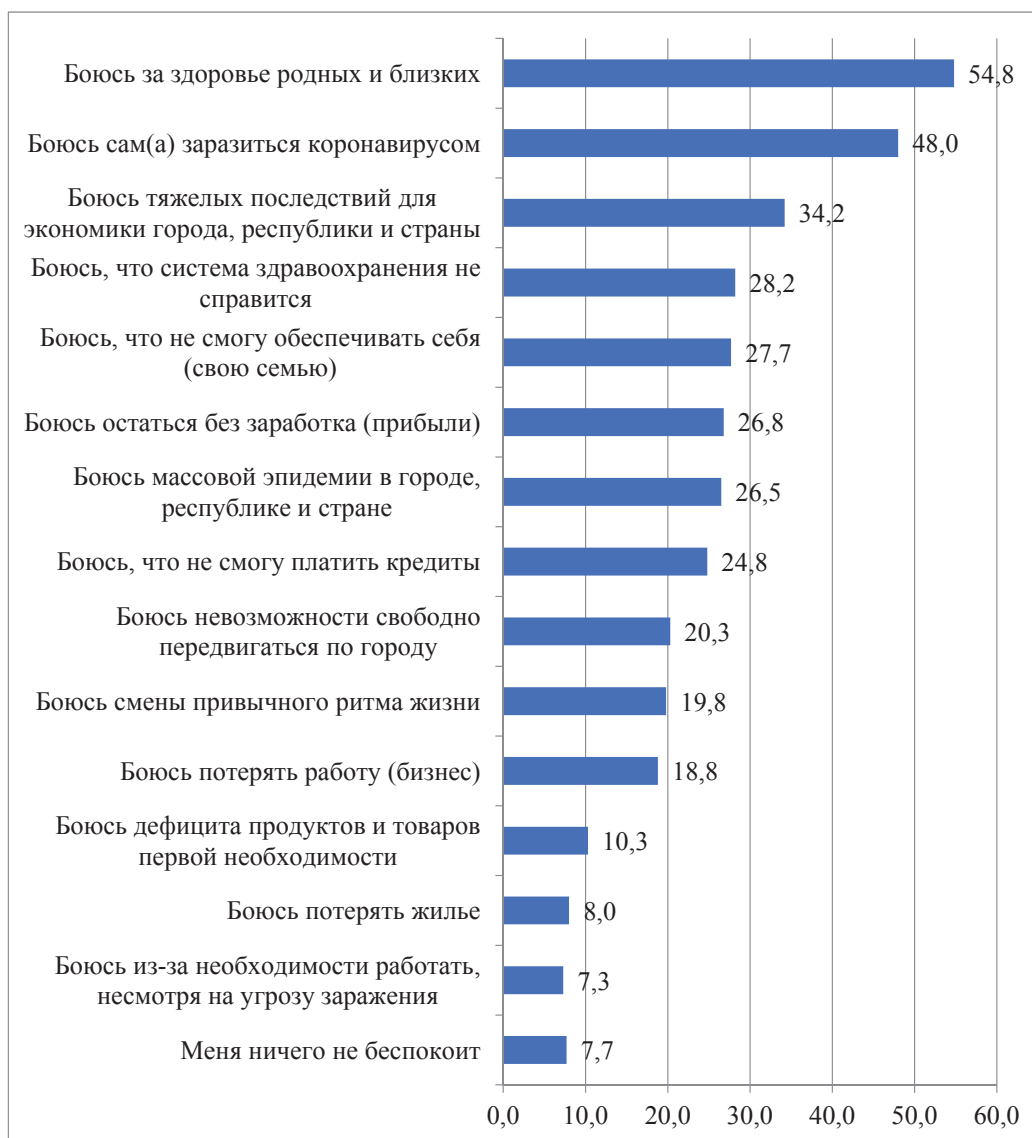
Рисунок 1. Распределение ответов респондентов на вопрос (многовариантный) «Что в сложившейся ситуации беспокоит Вас больше всего?», %

продуктов, 52,8 % опрошенных констатировали уменьшение уровня доходов, еще 21,3 % остались без дохода совсем. Но в полной мере население Казани еще не ощутило в начальный период пандемии финансовых трудностей, об этом говорит тот факт, что по мнению 43,5 % респондентов уровень их дохода не изменился.