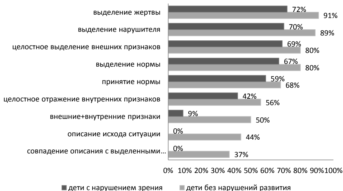
Рис. 2. Сравнительный анализ показателей школьников с нарушениями зрения и без нарушений зрения по методике «Предвосхищение исхода ситуации с нарушенной нормой»

Было установлено, что школьники успешно справляются с выделением жертвы и нарушителя в ситуации. При этом у младших школьников, не имеющих нарушений зрения, более высокие показатели по этим параметрам, что свидетельствует о том, что способность выделять внешние признаки ситуации проявляются лучше, чем у их сверстников с нарушениями зрения. Следует также отметить, что дети с нарушениями зрения успешнее выделяют жертву в ситуациях, которые им знакомы, идентифицируя себя с жертвой.