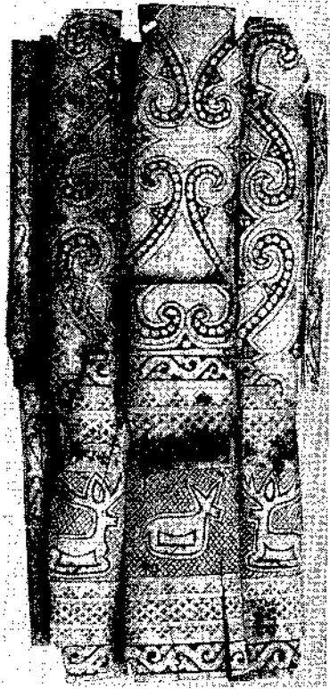
Рис. 4. Костяная орнаментированная обкладка колчана. Сидоры, к. 14, п. 1 (по: Золотая Орда 2005: 52, № 39)