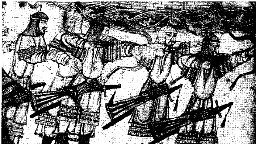
Рис. 5. Монгольские воины с колчанами, украшенными орнаментированными обкладками (с иранской миниатюры «Завоевание Багдада», 1300–1330 гг.; по: The Legacy 2002: 36, fig. 33)

ди золотоордынские поселения к остаткам малых городов, отличающихся от меньших по размеру селищ не только по площади, но и закономерностями социального порядка.