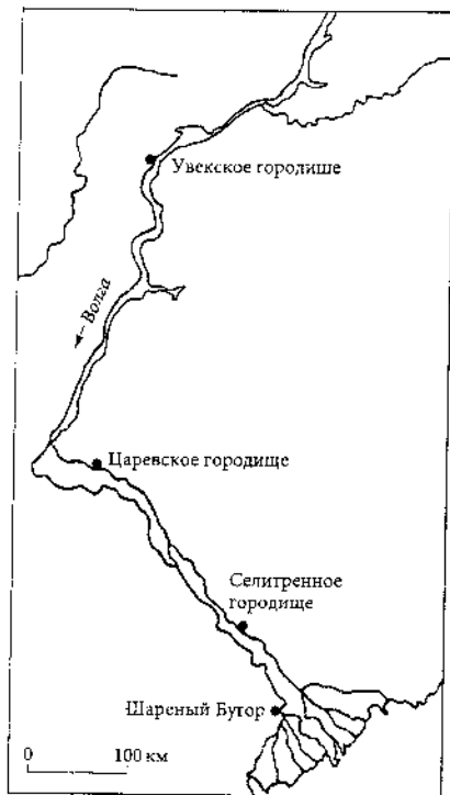
Рис. 1. Схема расположения крупнейших золотоордынских городищ Нижней Волги

представляется нам полностью оправданным, поскольку археологические признаки золотоордынского города вполне соотносимы с археологическими признаками древнерусских городов.