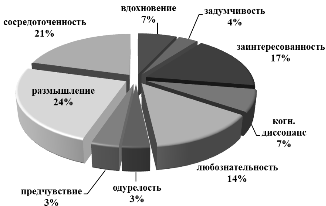
Рис. 1. Познавательные состояния в научно-исследовательской деятельности.