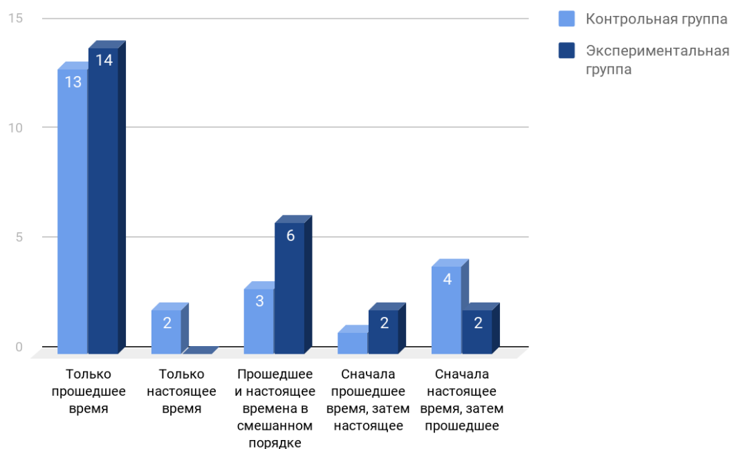
Рисунок 1. Диаграмма Выбор глагольных времен

Метод выборки отдельных глагольных времен в расшифровках пересказов обеих групп позволил сделать определенные выводы: контрольная и экспериментальная группы при построении устных дискурсов практически одинаково использовали только прошедшее время (контрольная – 13 случаев, экспериментальная – 14); употребление только настоящего времени у детей с РАС не было зафиксировано, тогда как у детей типичного развития встретилось 2 случая данного способа. Также аутисты чаще использовали прошедшее и настоящее времена в смешанном порядке (6) и сначала прошедшее, затем настоящее время (2) в отличие от контрольной группы (3 и 1 соответственно). Однако школьники с типичным развитием вдвое чаще применяли сначала настоящее время, а затем прошедшее (4, экспериментальная группа – 2) (см. рисунок 1).