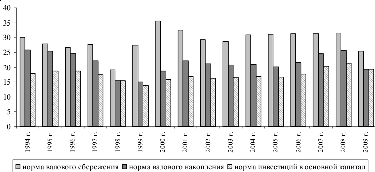
Рис. 2. Динамика нормы валового сбережения, нормы валового накопления и нормы инвестиций в основной капитал в 1994-2009 г.г. (в % к ВВП)

Согласно кейнсианской концепции, сбережения должны быть равны инвестициям. В рамках национальной экономики, в условиях неполной занятости такое равенство практически недостижимо, поскольку в условиях глобализации мировой системы происходит постоянное перемещение капитала. Однако, в рамках мирового хозяйства данное равенство должно выполняться. Но, как показывают данные МВФ, выдвинутая гипотеза не подтверждается. Только в 2004 г. мировые сбережения были равны мировым инвестициям. На протяжении 1995-2003 г.г. инвестиции превышали сбережения на 0,1-0,2%, но, начиная с 2005 г. тенденция сменилась на противоположную. По прогнозам экспертов, сбережения будут превышать инвестиции на 0,6-0,9% в период до 2014 г. 1 В период экономического роста в мире наблюдалось превышение инвестиций над сбережениями, в первую очередь, в развитых странах. Это можно объяснить тем, что развивающиеся страны направляли свои сбережения в развитые страны в виде инвестиций. В 2008 г. в новых индустриальных странах Азии норма сбережения превышала норму инвестиций на 4,5%, в то время как в развитых странах норма инвестиций превышала норму сбережений на 1,5% а в США – на 5,6%