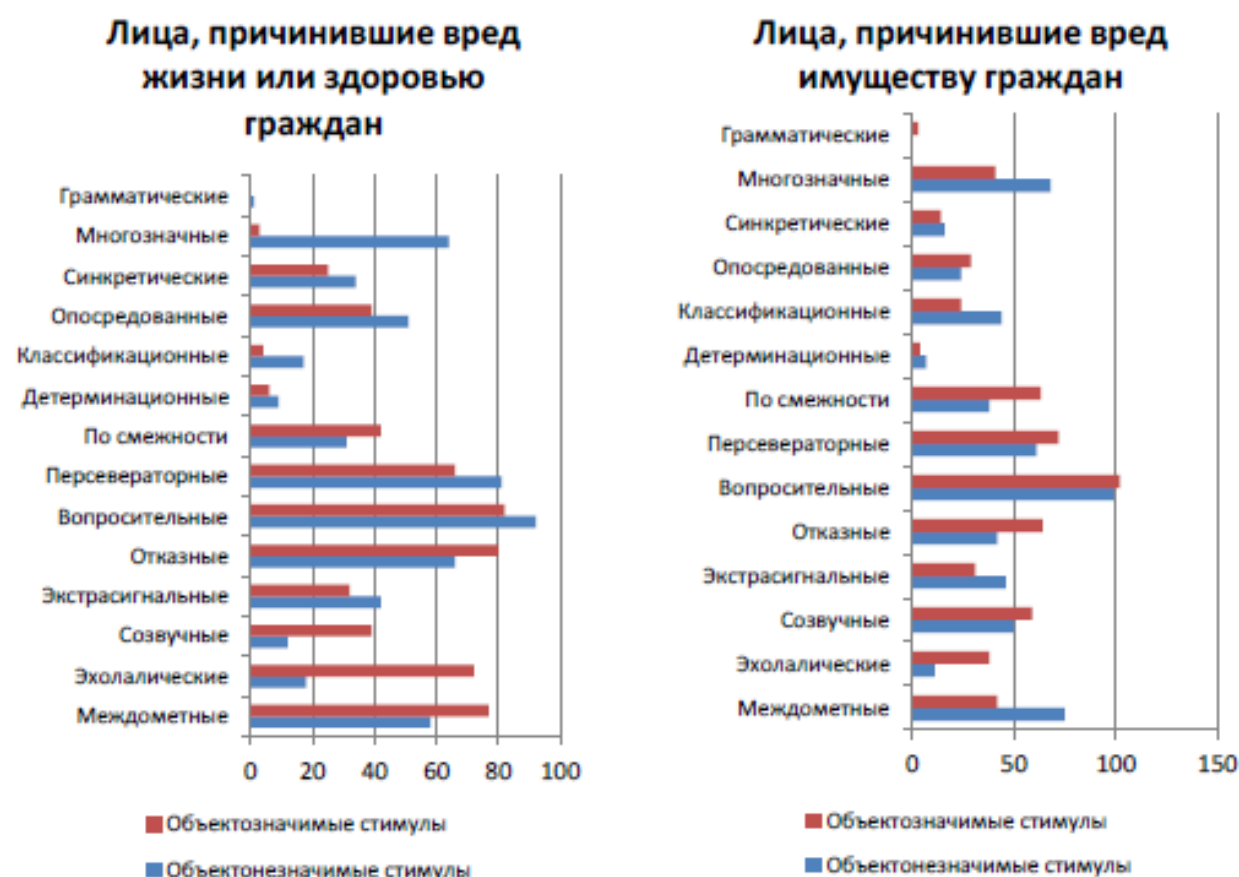
Рис. 3. Профиль ассоциативных реакций на объектозначимые и объектонезначимые стимулы у лиц, причинивших вред имуществу граждан, и лиц, причинивших вред жизни или здоровью граждан

В результате исследования ассоциативных реакций у лиц, причинивших вред жизни или здоровью граждан, на объектозначимые стимулы выявлено преобладание персевераторных, эхолических, отказных, междометных, вопросительных ассоциативных реакций при минимальной представленности или отсутствии классификационных, детерминационных, многозначных и грамматических ассоциативных реакций (рис. 3).