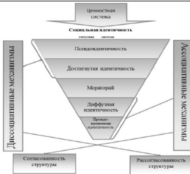
Рис. 1. Концептуальная схема исследования ассоциативно-диссоциативных механизмов регуляции социальной идентичности лиц, находящихся в местах лишения свободы

Диссоциативные механизмы поддерживают рассогласованность структурной организации идентичности, проявляющуюся в отчуждении собственных действий. Отчуждение собственного противоправного деяния приводит к высшим статусам идентичности. Ассоциативные механизмы обеспечивают согласованность структурной организации идентичности, что проявляется в принятии собственных действий и приводит в данном варианте к развитию делинквентной идентичности.