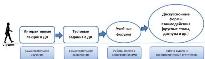
Рис.1 Траектория освоения студентом теоретического материала

Все изложенные методы и технологии оказались эффективными в условиях освоения студентом теоретического материала по представленной траектории [4]: студент сначала самостоятельно изучает теорию в интерактивной лекции с вопросами, затем выполняет тестовые задания, совместно с одногруппниками и преподавателем участвует в учебных форумах, готовится к участию в дискуссионных формах взаимодействия, и в итоге рефлексиирует свою учебную деятельность (рис.1).