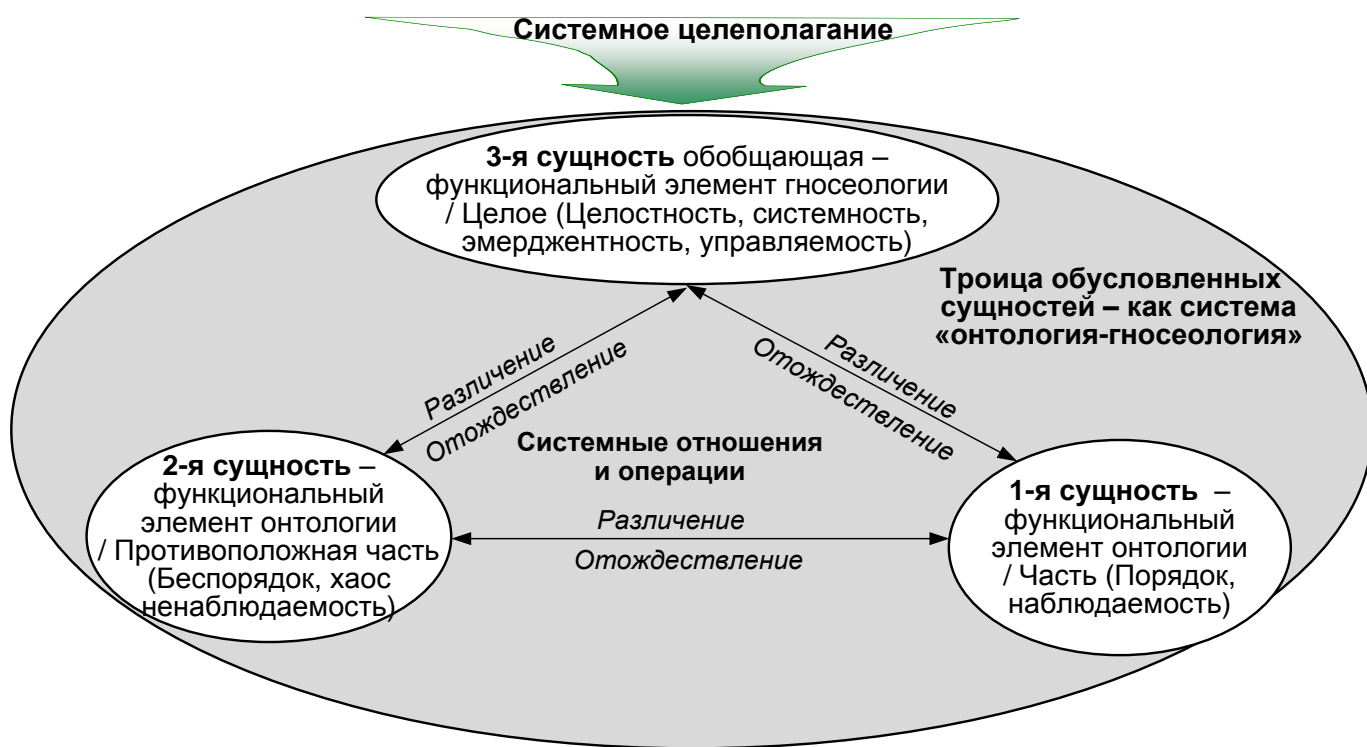
Рис. 1. Троица обусловленных системных сущностей комплексного отражения мира,

общую теорию классификации [2], и систематизации [3], в основе которых, как и в основе всего сущего и несущего, лежит фундаментальный древнерусский (древнеарийский) принцип двойкости или двоицы противоположных, соразмерных и равновесных сущностей, который нашел отражение во всех древних писаниях, в религиях, учениях и культурах народов мира [4, 5]. Эта двоица сущностей и есть онтология – как бесконечное множество объектов, процессов и явлений мира, действительности, бытия (рис. 1). Но во всем должна быть система, в том числе философская система «онтология – гносеология». Значит комплексное взаимодействие противоположных сущностей достигается в системе – тройке обусловленных и проявленных системных сущностей, известной нашим отцам-основателям с глубокой древности. Это и есть сакральное древнеарийское «тройкое знание», знаменитая древнерусская тризна (тройка, троица), ведическая трилока, авестийская троякость, древнекитайская триграмма [4, 5].