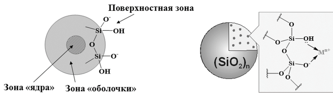
Рисунок 1. Бочкова О.Д.