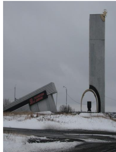
Памятник, посвященный стахановскому движению Иллюстрация 11

Советская эпоха «фиксировала» в пространстве города достижения советского народа посредством памятников, символов, лозунгов, тем самым, визуально через образы, определяя, что значит быть настоящим патриотом родины. Несмотря на то, что в своём большинстве молодые воркутинцы не видят в истории родного города патриотического подтекста, визуальный компонент советского патриотизма продолжает «работать». Это объясняется, прежде всего, существующими просоветскими установками у молодёжи. В ответах ребят очевидна потребность ощущать свою страну таким же сильным государством, каким был Советский Союз при И.В. Сталине или Российская империя при Петре I. Советские символы, в какой-то степени, символически демонстрируют былую