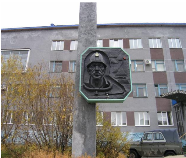
Иллюстрация 1: Памятный знак «Монумент бесстрашным» (1983). Памятник прославляет героев горноспасателей.

Патриотизм «по-советски» обусловленный локальным предназначением Воркуты – добычей угля в суровых условиях севера. Шахтерская профессия представлялась как героическая. Символическое выражение подвига, самоотверженного труда сохранилось в памятниках, установленных в честь шахтеров в советское время. Сам город является своеобразным символом доблестного труда геологов, шахтеров, многие из которых были заключенными.