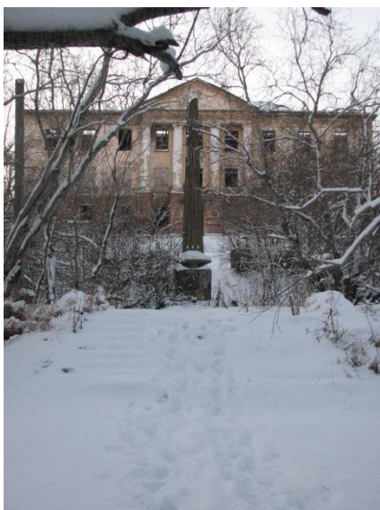
Иллюстрация 3: Обелиск первым геологам на Руднике перед Домом культуры.

Однако помимо памятников, символов, знаков в визуальном пространстве города есть место, которое обладает особой энергетикой и историей – это Рудник. Рудник – в прошлом поселок, а сегодня это брошенный район города, где в 30-х гг. располагалась первое поселение геологов. Отсюда собственно начиналась Воркута. По месту расположения Рудник находится на другом берегу реки и соединяется мостом с остальной частью города. В 90-е годы Рудник как район города закрыли местные власти из-за нерентабельности – требовалось слишком много ресурсов на содержание. В настоящее время здесь сохранились «коробки» пятиэтажных жилых домов, Дворец культуры с колоннами, памятник геологам-первооткрывателям, крест в память заключенным, благодаря кому было начато освоение Печорского угольного бассейна. С точки зрения визуального восприятия Рудник символически представляет собой героическое прошлое и безрадостное будущее самой Воркуты. Рудник – точка на карте города, откуда начиналась преодоление, казалось, невозможного – вечной мерзлоты, жестоких условий тундры, но одновременно Рудник - знак упадка былой мощи советского государства. Именно развал СССР, по сути, превратил процветающий район города в развалины.