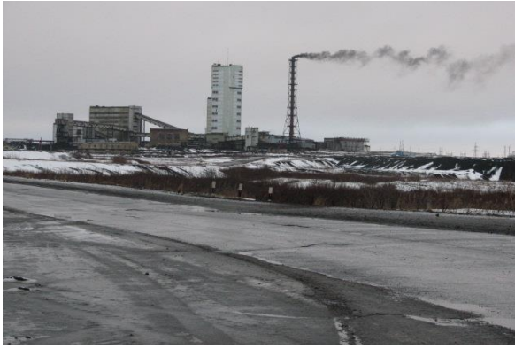
Иллюстрация 4: Самая крупная шахта – Воргошорская