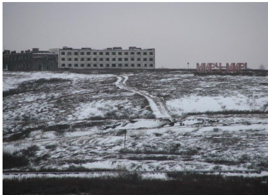
Иллюстрация 6: Лозунг «МИРУ МИР» в тундре

Прославлялся не только шахтерский труд, но также труд строителей, которые в условиях крайнего севера создавали уникальную «городскую ткань». Архитектура города отличается строгостью, классическим стилем, многие здания представляют собой не только шедевры зодчества, но и символизируют репрессивную составляющую истории возникновения города: большинство из них спроектированы и построены заключенными.