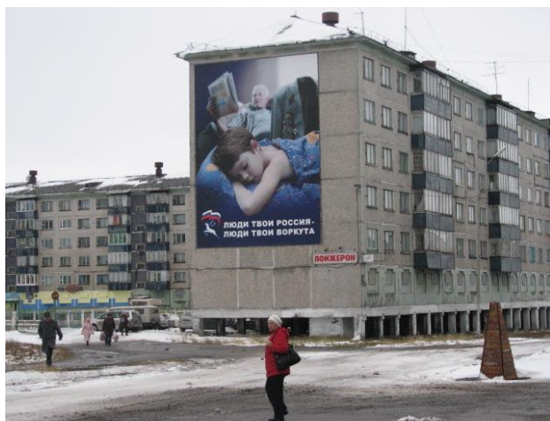
Иллюстрация 12: Рекламный щит на доме с надписью: «Люди твои Россия, люди твои Воркута»

Кроме того, в рекламных плакатах современности как и в советскую пору отсутствует настоящее, другими словами, говорится образно о героическом прошлом и «светлом будущем», но умалчивается сложившаяся кризисная ситуация сегодня, которая не дает объективных оснований думать, что город в ближайшее время преодолет социально-экономическую депрессию.