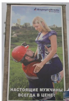
Иллюстрация 15: Рекламный плакат на здании гласит: «Настоящие мужчины всегда в цене!»

Основные используемые образы – это шахтеры – сильные, мужественные и уверенные в завтрашнем дне, люди престижной профессии, люди-герои сегодняшнего дня. Создаются образы шахтеров через привычные патриархальные стереотипы, что отражается в визуальном исполнении. К примеру, на современных билбордах мы видим традиционные патриархальные взаимоотношения: сильный мужчина и слабая женщина, причем сила мужчины изображена не только в действии (он поднимает на руки женщину), но и в профессии шахтера, потому что быть шахтером влечет за собой целый ряд характеристик, приписываемых маскулинности: риск, смелость, сила, мужество, тяжелый физический труд, преодоление трудностей, ответственность и т.п. (Иллюстрация ниже)