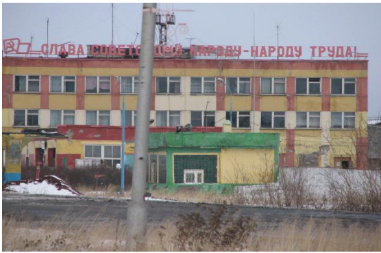
Иллюстрация 8: Надпись на здании: «Слава советскому народу – народу труда!»

Открытие новой шахты, стахановское движение по добыче угля, труд в условиях севера, несмотря на гибель, рассматривались как долг родине, а значит выражение истинного патриотизма. И, в целом, идеологически это было свойственно всем советским городам с градообразующей индустрией, имеющих стратегически важное производство, как, к примеру, угольная промышленность в Воркуте. «Следы» советской власти в сегодняшней Воркуте прекрасно сочетаются с современными символами власти. Существующее идеологическое противоречие между «советским» прошлым и «демократичным» настоящим не ощущается, по крайней мере, на визуальном уровне это можно утверждать с уверенностью.