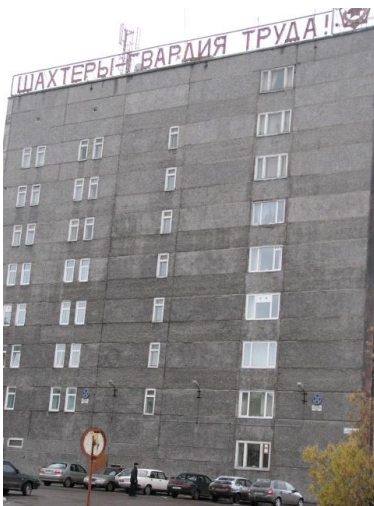
Иллюстрация 5: Надпись на доме «Шахтеры – гвардия труда!»