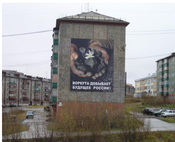
Иллюстрация 16: Рекламный плакат ВоркутаУголь «Воркута добывает будущее России!»

Однако в реальной жизни для многих респондентов шахтерская профессия сопряжена с риском для жизни и при этом мало оплачиваемая, а значит и не престижная. Эта точка зрения подкрепляется семейными историями, где отец или брат были шахтерами, и сегодня остались ни с чем, или получили производственную травму. Другими словами, благодаря современным визуальным образам создается воображаемое пространство, где через формирование локального патриотизма, символического убеждения, складывается чувство, что Воркута – необходима стране, что экономические трудности преодолимы, что впереди Воркуту ждет процветание и т.д.