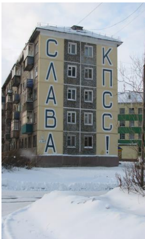
СЛАВА КПСС! Иллюстрация 9

Открытие новой шахты, стахановское движение по добыче угля, труд в условиях севера, несмотря на гибель, рассматривались как долг родине, а значит выражение истинного патриотизма. И, в целом, идеологически это было свойственно всем советским городам с градообразующей индустрией, имеющих стратегически важное производство, как, к примеру, угольная промышленность в Воркуте. «Следы» советской власти в сегодняшней Воркуте прекрасно сочетаются с современными символами власти. Существующее идеологическое противоречие между «советским» прошлым и «демократичным» настоящим не ощущается, по крайней мере, на визуальном уровне это можно утверждать с уверенностью.