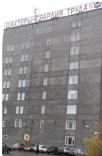
«Шахтеры – гвардия труда!» Иллюстрация 10