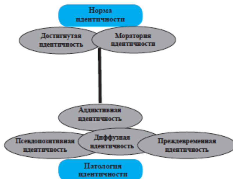
Рис. 1. Распределение статусной системы идентичности в континууме «позитивная идентичность – негативная идентичность».

Совмещая две исследовательские позиции (Л.Б. Шнейдер [25, 26] и Н.В. Дмитриевой [6, 8]), представим схему, отражающую распределение статусной системы идентичности в континууме «позитивная идентичность — негативная идентичность». Аддиктивная идентичность генерирует проявления статусов негативной трансформации. В качестве базисной основы негативной трансформации идентичности выступает диффузная идентичность. Статус моратория идентичности, характеризующий кризисы идентичности, указывает на сохранный ресурс (рис. 1).