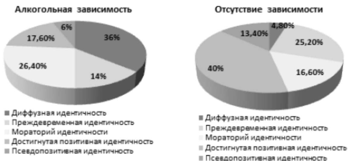
Рис. 3. Статусная система личностной идентичности при отсутствии наркотической зависимости.

самооценкой, приводящей к сомнениям в своей способности что-то изменить или предпринять (рис. 2).