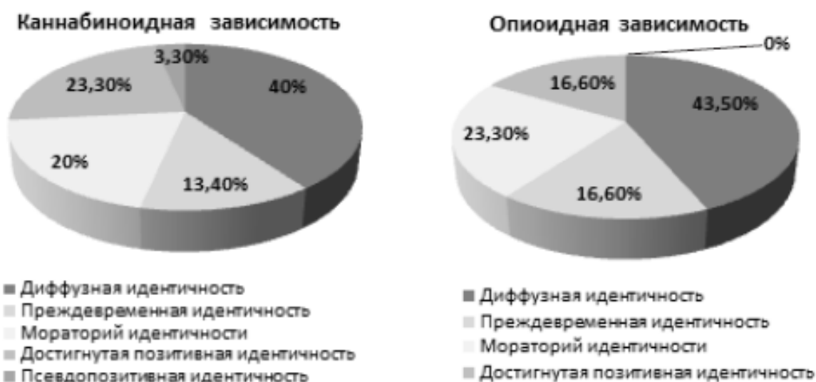
Рис. 2. Статусная система личностной идентичности при наркотической зависимости.