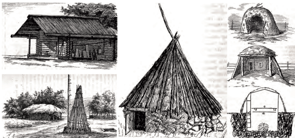
Рис. 1. Реконструкция жилища по Heikel A.O. Fig. 1. Reconstruction of a dwelling after Heikel A. O.

стью переписан, при этом фактология оставлена без изменений) вышли отдельным изданием (Миллер, 1791) (рис. 2: б–в). В структурном отношении исследование состоит из восьми глав, одна из которых посвящена жилым сооружениям. С помощью нескольких гидронимов и топонимов Г.Ф. Миллер отмечает: «...Множество находящихся в сих местах лесов есть ... причиною, что все вышеупомянутые народы жилища имеют или в лесах, и к поселению своему выбирали такие места, что каждая деревня построена при нарочитой реке, или речке, или озере...» (Миллер, 1791, с. 36).