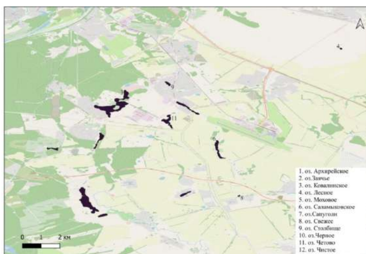
Рис. 1. Месторасположение особо охраняемых озер Лаишевского муниципального района Республики Татарстан

Объектом исследования были 12 озер, имеющих особый природоохранный статус, расположенных на территории Лаишевского муниципального района Республики Татарстан (рис. 1).