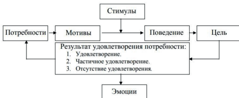
Рис. 1. Мотивационная структура личности

Приобщение человека к здоровому образу жизни невозможно без соответствующей у него мотивации. Мотивация – это система психологически разнородных факторов, обуславливающих поведение и деятельность личности. Структура мотивации является сложным структурным образованием и включает в себя потребности, мотивы, стимулы, цель и эмоции (рис. 1). Мотив представляет собой опредмеченную потребность, т.е. всегда имеется объект, из-за которого активизируется деятельность личности. Поскольку мотивацию порождает побуждение, т.е. стремление удовлетворить потребность, вместе с этим приходит осознание стимула и придание ему значимости, смысла. Также под мотивом понимают причину, которая лежит в основе выбора действий и поступков, и совокупность внешних и внутренних условий, вызывающих активность субъекта. Совокупность относительно устойчивых и доминирующих мотивов человека называется мотивационной сферой. Мотивационная сфера в целом выражает направленность личности, ценностные ориентации и определяет ее деятельность.