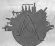
Катализаторы и Адсорбенты