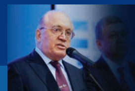
Виктор Садовничий академик РАН, ректор МГУ имени М.В. Ломоносова