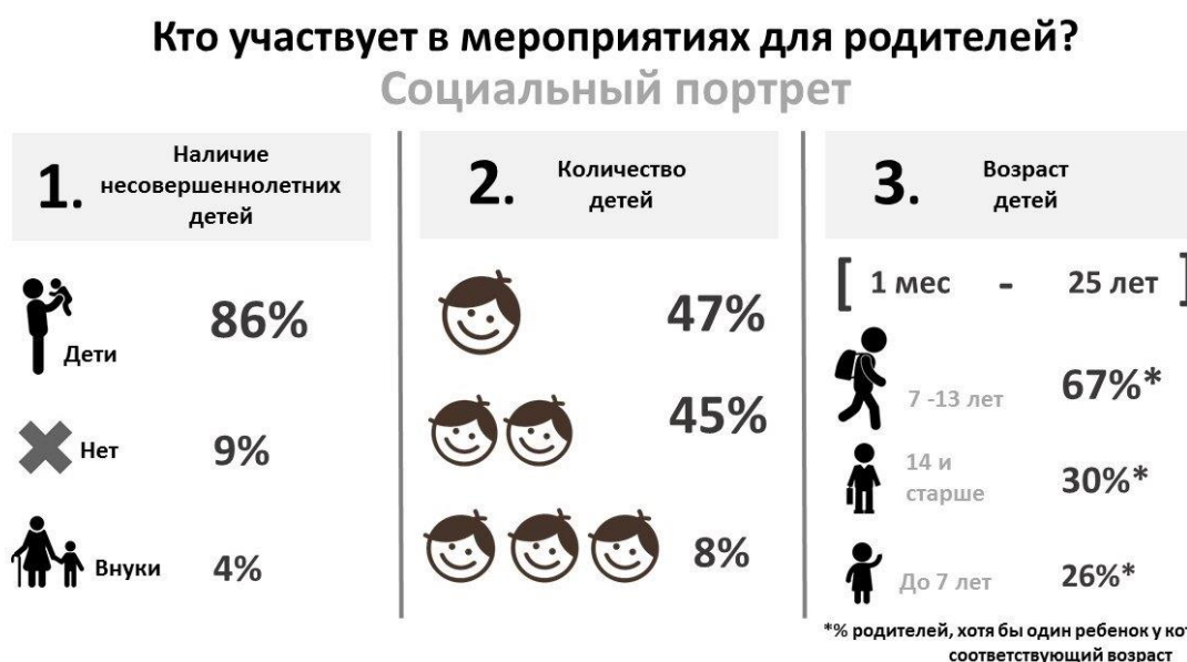
Рис. 3 – Социальный портрет участников мероприятий для родителей: количество и возраст детей