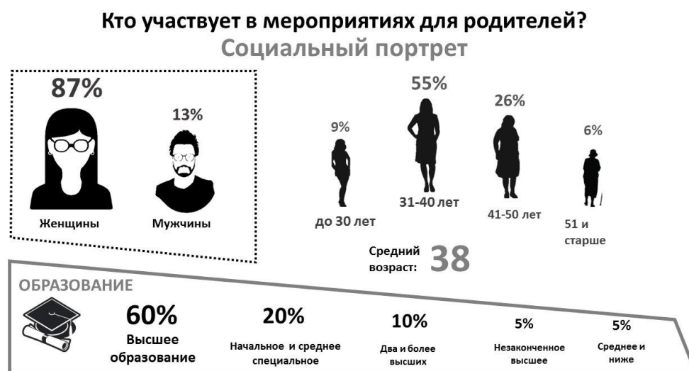
Рис. 2 – Социальный портрет участников мероприятий для родителей: пол, возраст, образование

родительского образования Казанского открытого университета талантов 2.0., в разных городах Республики Татарстан в период с октября по декабрь 2016 года.