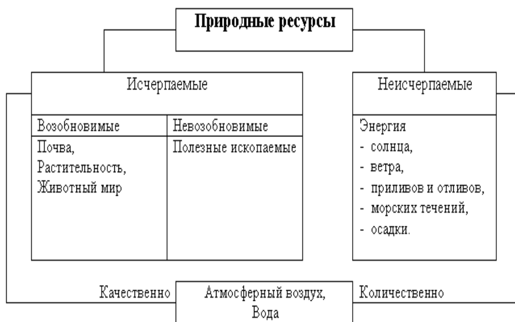
Рис. 2.1. Классификация природных ресурсов по их исчерпаемости и возобновляемости

Перечисленные природные ресурсы обладают большой самовозобновляющейся силой и возможностью. Однако такие ресурсы как воздух и вода подвержены значительным изменениям под воздействием хозяйственной деятельности человека. Их растущее загрязнение различного рода отходами производства и потребления может привести и уже привело в отдельных индустриально развитых регионах к качественному истощению и дефициту этих видов ресурсов. Хозяйственная деятельность оказывает влияние и на другие виды неисчерпаемых природных ресурсов: космические ресурсы – солнечную радиацию, энергию морских приливов и отливов. В частности, изменение состава атмосферного воздуха вследствие загрязнения, может оказать влияние на величину притока солнечной радиации.