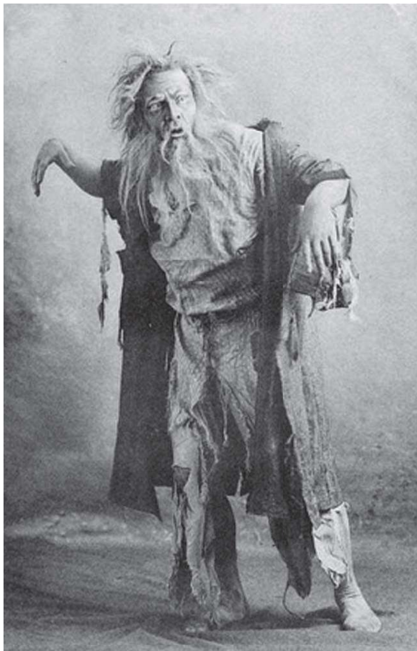
Федор Шаляпин в партии Мельника в опере А. Даргомыжского «Русалка»

В 1908 г. в Париже Ф. И. Шаляпин начинает сотрудничать с выдающимся антрепренером Сергеем Дягилевым. Вместе они поставили многие известные русские оперы. В 1913 г. артист создал несколько русских образов в Ковент-Гарден. После Лондона и Парижа Федор Иванович начал давать сольные концерты, в которых исполнял русские народные песни и авторские произведения. Признанный великим артистом,