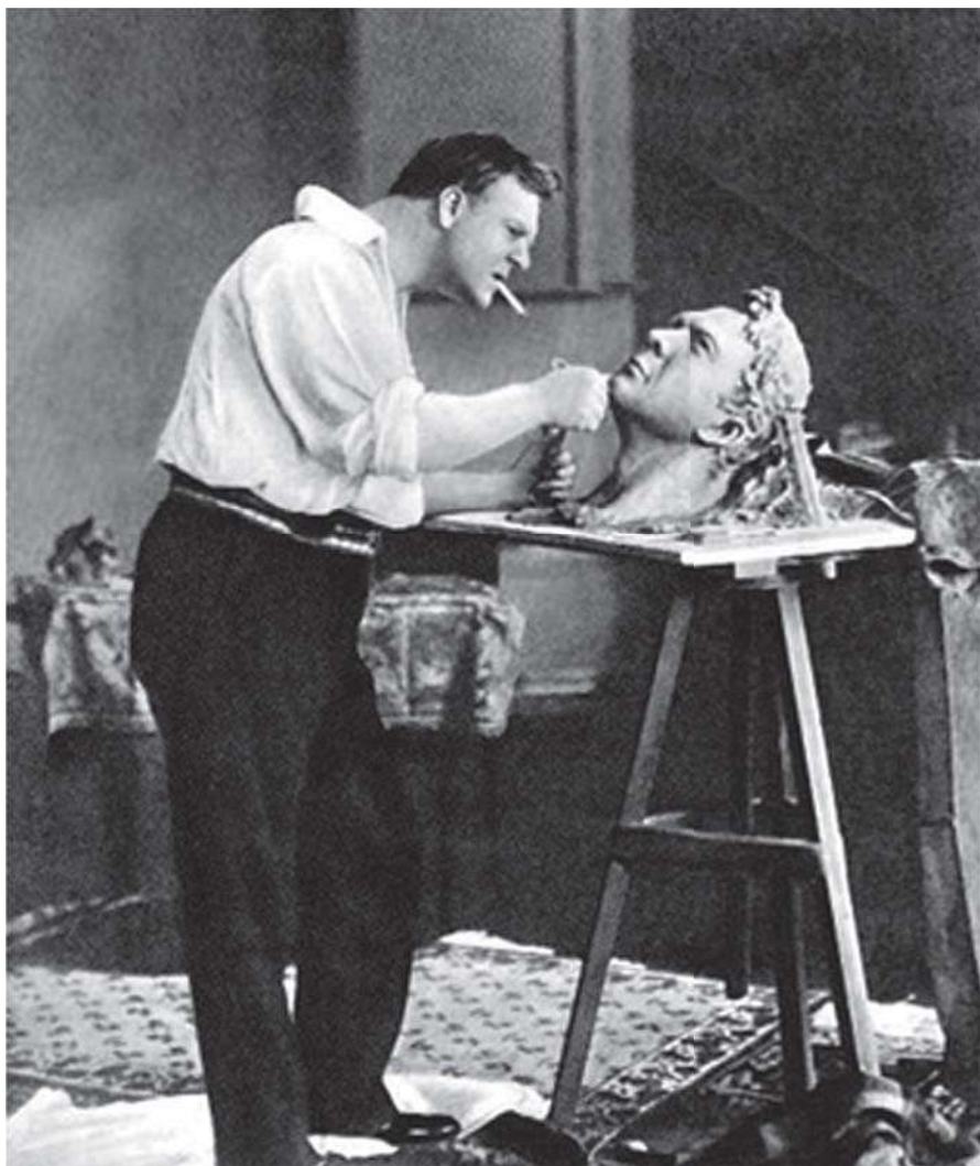
Федор Шаляпин за работой над своим скульптурным автопортретом, 1912 г.

Судьба свела Ф. Шаляпина с выдающимся меценатом Саввой Мамонтовым, который предложил ему место солиста на сцене Московской частной русской оперы. Именно здесь с 1896 г. известный певец выступал в течение четырех сезонов, совершенствуя свой репертуар и мастерство.