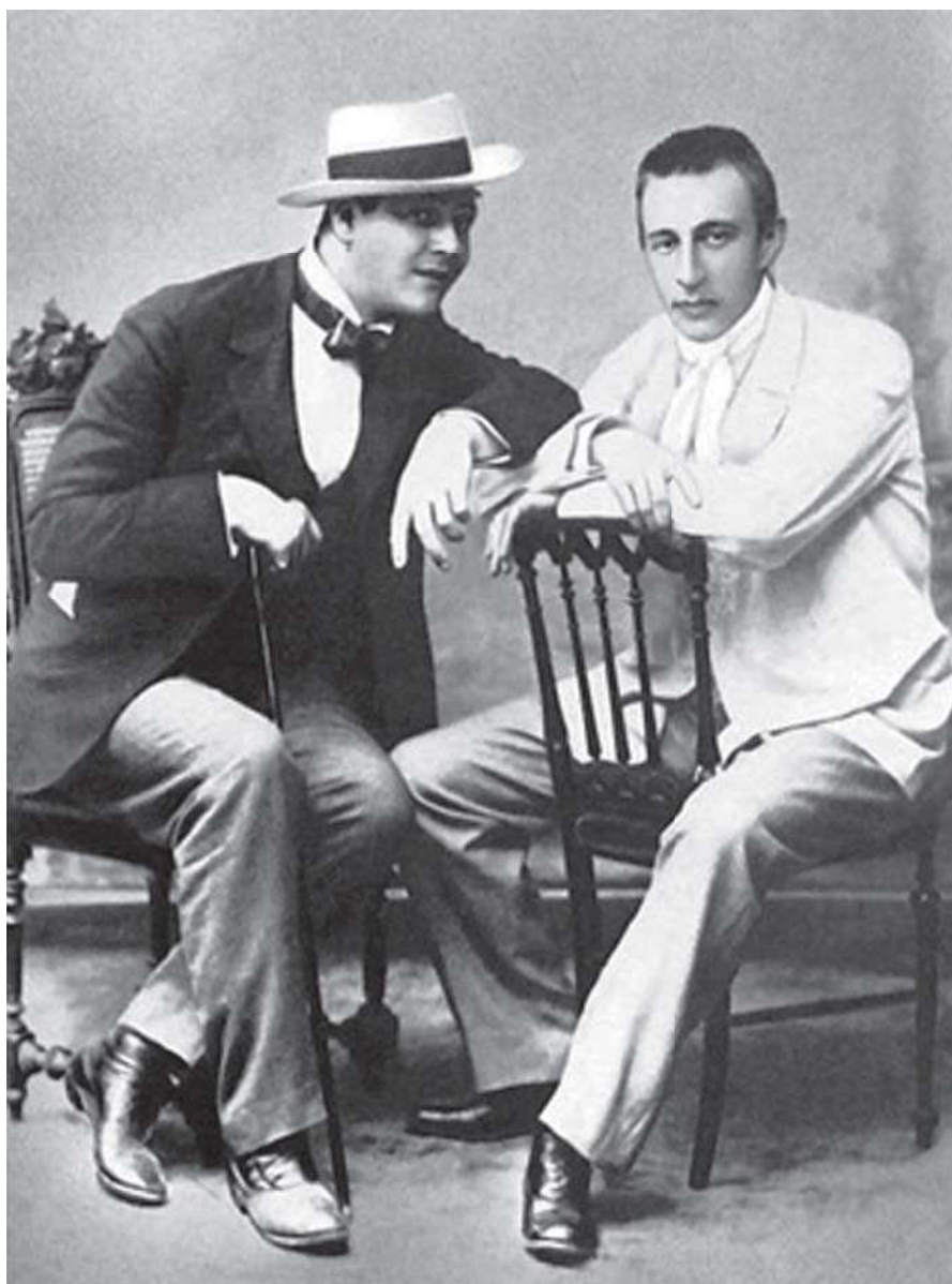
Федор Шаляпин и Сергей Рахманинов