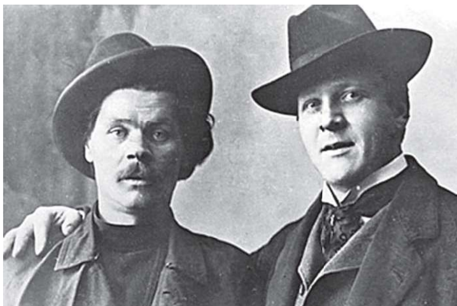
Горький и Шаляпин. 1903 г.

В 1894 г. певец был принят в труппу Мариинского театра в Санкт-Петербурге. В апреле 1895 г. Федор Шаляпин дебютировал в роли Мефистофеля в опере Шарля Гуно «Фауст» в Мариинском театре [3]. А через два года его пригласили в частную оперу С. Мамонтова в Москве, в которой он блистал в течение трех лет.