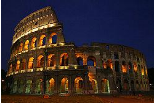
Колизей в Риме, Италия.

Имперский период наступил в конце I в. до н. э., когда Римское государство из аристократической республики превратилось в Римскую империю - мировую рабовладельческую державу, разнородную по этническому и социальному составу, сложную по хозяйственной и общественной организации.