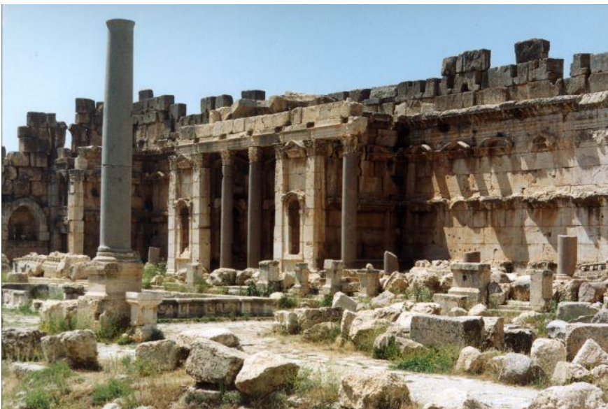
Величайший храм Юпитера, бог богов.

Храм Весты (лат. Aedes Vestae ) — развалины античного храма, посвящённого Весте, римской богине домашнего очага. Располагается в Риме неподалёку от храма Цезаря на римском форуме, в южной части Священной дороги.