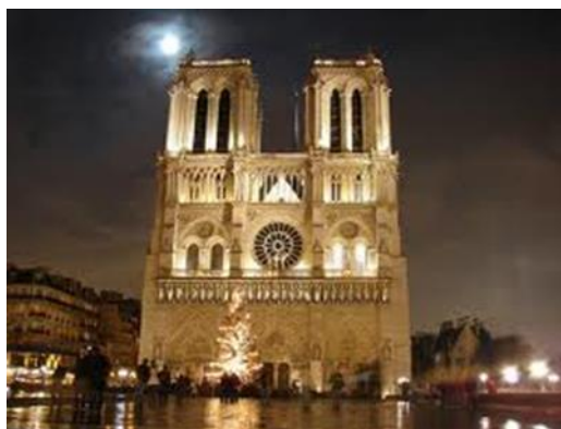
Собор Парижской Богоматери - величественный Нотр-Дам де Пари.

Этот стиль заметно отличается от тяжеловесного романского стиля. Форма отличается легкостью, стройностью, остротой шпилей. Готический собор – новое решение базиликального типа постройки. Главное отличие готического собора – устойчивая каркасная система, в которой главную конструктивную роль играют стрельчатые своды. Первые памятники готики - монастырь Сен-Дени в Иль-де-Франс (XII в). Выдающееся творение французской готики - собор Парижской Богоматери (Нотр-Дам-де-Пари, XII-XIV вв.). Огромный резной алтарь представляет сорок сцен из жизни Иисуса и Девы Марии. На полу собора размечен своеобразный лабиринт для кающихся паломников, которым следовало пройти весь путь на коленях.