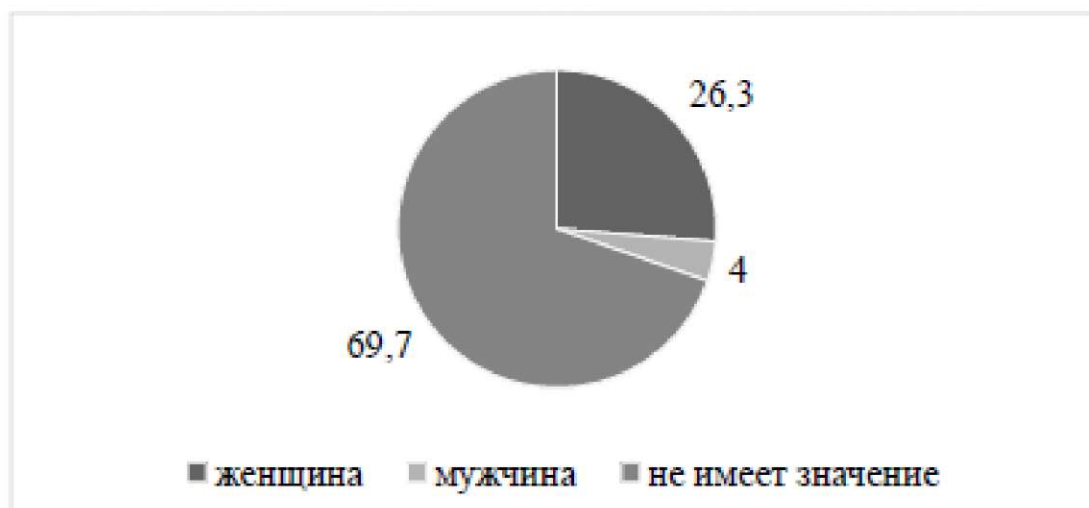
Рис. 2. Распределение ответов респондентов на вопрос «Идеальный классный руководитель должен быть...»

Мы также выяснили, что девочкам важно, чтобы классный руководитель была женщиной, для мальчиков не имеет значения, какого пола классный руководитель. Данные выводы подтвердились статисти-