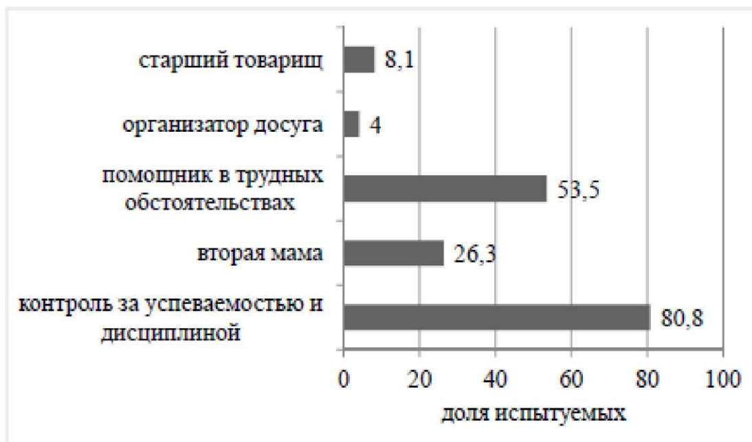
Рис. 1. Распределение ответов респондентов на вопрос «Какую роль должен исполнять классный руководитель в классе?»

Учащиеся младших классов на вопрос «Какую роль должен исполнять классный руководитель в классе?» ответили следующим образом (рис. 1):