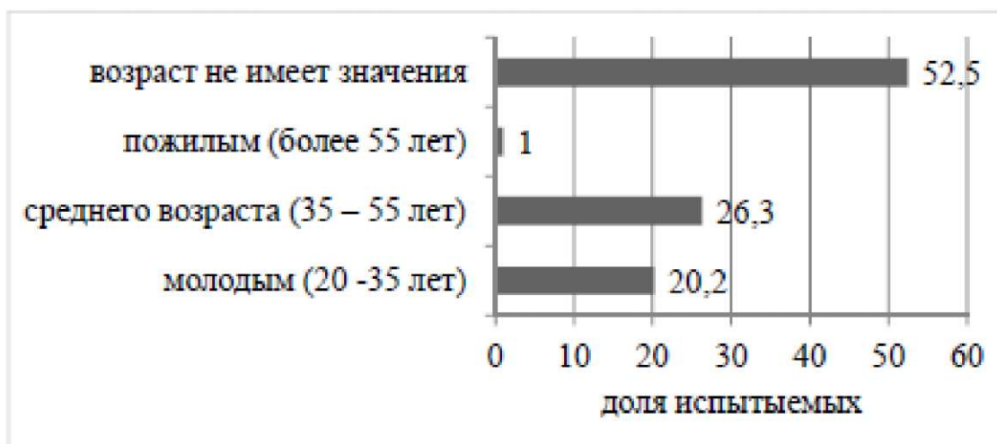
Рис. 3. Распределение ответов респондентов на вопрос «Возраст идеального классного руководителя»

Далее мы выяснили предпочтения младших школьников по возрасту классного руководителя (рис. 3).