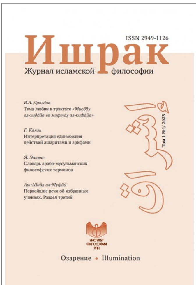
Рис. 1. Обложка первого номера журнала Ишрак за 2023 год.