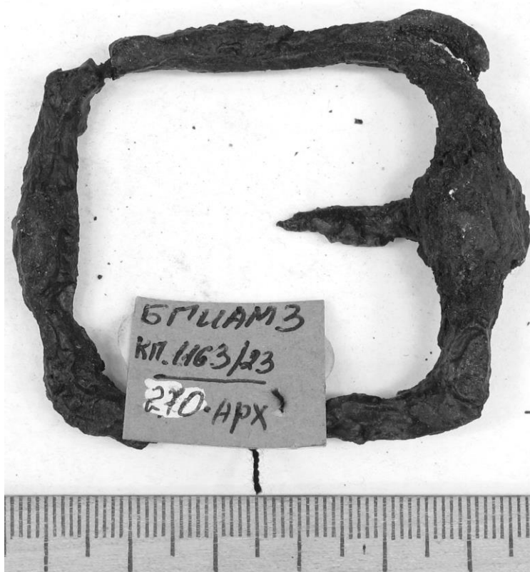
Рисунок 4 – Пряжка с сохраненным покрытием полимеризованного клея БФ до реставрации

Предметы вымачивались в растворе, затем помещались на 1 сутки в нагревательную печь при температурах 185, 200, 210 °С, или