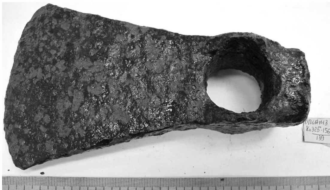
Рисунок 3 – Мотыга с частичным покрытием полимеризованного клея БФ до реставрации