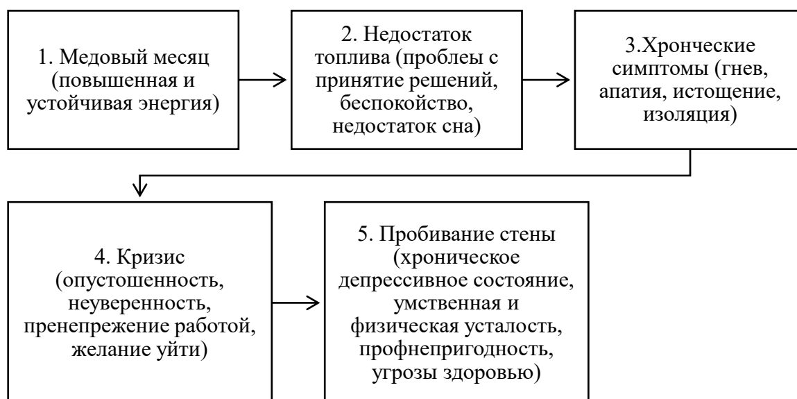
Рис. 2 Стадии эмоционального выгорания по Дж. Гринбергу

Рассматривая понятие профессионального выгорания, отождествляющегося с выгоранием эмоциональным, обратимся к трактовке основоположника проблемы Г. Фрейденбергу [1, с. 160], раскрывающего данную категорию как психологическую характеристику, свойства здоровых людей, тесно контактирующих с клиентами, работа которых характеризуется принципом «человек-человек». Наиболее подверженных синдрому эмоционального выгорания ученый определил как людей-сотрудников, которым свойственны высокий уровень гуманности и сострадания, благотворительность, увлеченность идеями, эмоциональная нестабильность. Профессор психологии К. Маслач [2, с. 29], сформулировала следующие характеристики синдрома эмоционального выгорания: низкая самооценка, потеря положительных эмоций, слабая эмоциональная реакция, редукция профессиональных достижений. В свою очередь, Дж. Гринберг [3, с. 42] определил следующие стадии процесса профессионального выгорания: от устойчивой энергетики до кризисного этапа и «пробивания стены» (рис. 2).