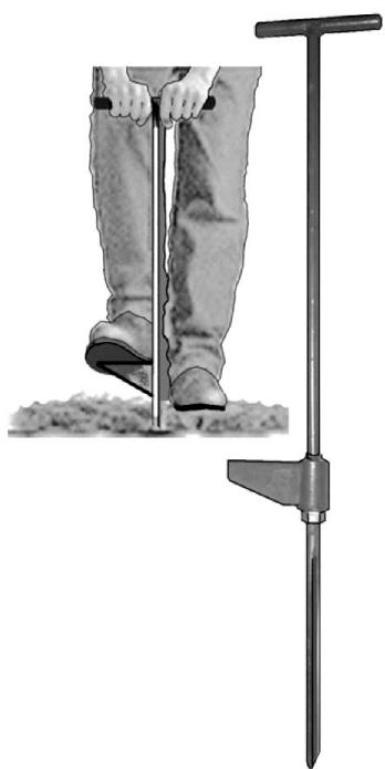
Рис. 1. Отбор точечных проб с помощью тростевого бура (типа БП-25-15)

Отбор проб тепличного грунта проводят как до высадки овощной культуры для расчета предпосевного внесения удобрений (основное