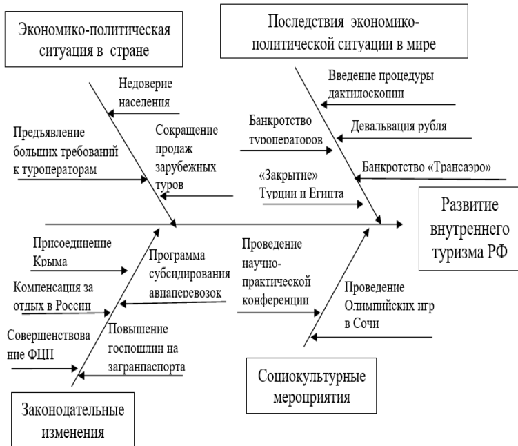
Рис.1. Диаграмма Исикавы. Факторы развития внутреннего туризма.

Итак, на основе детального факторного анализа развития внутреннего туризма России в 2014-2015 гг. мы сделали вывод, что существенным толчком подъема отрасли послужила негативная внешнеэкономическая и политическая ситуация в мире, отразившаяся наибольшими количественными и качественными факторными показателями в диаграмме Исикавы. Наиболее гибко и эффективно на эти изменения отреагировало Правительство РФ, создав благоприятные правовые условия для развития внутреннего туризма России.