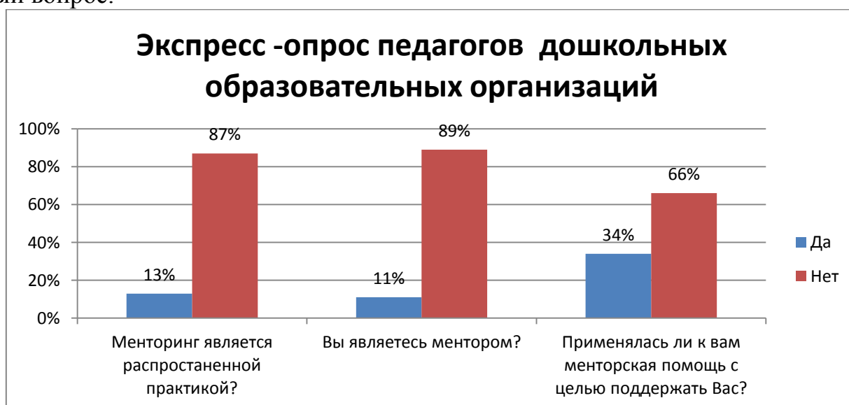
Рис.2. Распространенность менторинга на территории Российской Федерации

В нашем исследовании, проходившем в Казанском Федеральном университете в Институте психологии и образования (2018-2020г.), приняло участие 150 педагогов дошкольных образовательных организаций РФ (Москва, Самарская и Нижегородская области, а также Республики Татарстан). Нами было установлено, что в 87% опрошенных считают, что менторинг, к сожалению, не является распространенной практикой. Лишь 13% опрошенных признались, что такая практика существует в их дошкольных образовательных организациях. На вопрос «Являетесь ли вы ментором?» ответили «да» - 11% респондентов и в 89% респондентов опровергли этот факт. Последний вопрос «Применялась ли по отношению к вам менторская помощь?» Педагоги ответили - в большинстве 66% - «Нет» и лишь 34% ответили положительно на данный вопрос.