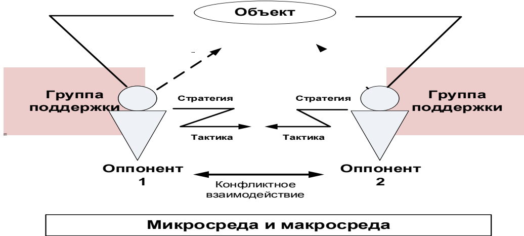
Рисунок 1- Структура конфликта