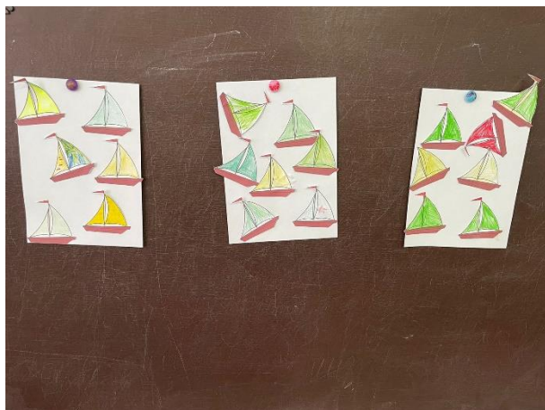
Рис. 5 Рефлексивный этап по уроку «Литературное чтение», тема «Л.Н. Толстой «Акула»».

Таблица – результаты констатирующего этапа на основании проведенных методик