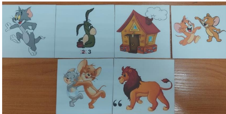
Рис.2 Поговорка «Кот из дома, мыши в пляс».

Использование подобных мнемотаблиц определяет основу развития мышления составляет формирование и совершенствование мыслительных операций. Овладение мыслительными операциями, как сравнение, анализ, обобщение, происходит по общему закону усвоения и интериоризации ориентировочных действий. Характер внешних действий определяют форму мыслительного действия ребёнка: или действие связано с образом, или – со знаком (слово, число). Таким образом, базируясь на доминирующем способе решения умственных и практических задач проявляется вид мышления ребёнка: наглядно-действенное, наглядно-образное, словесно-логическое.