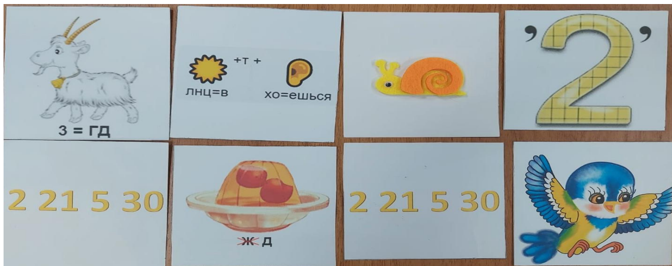
Рис.1 Пословица «Когда советуешься, будь улиткой, в деле будь птицей».

Поддержание активной познавательной деятельности младших школьников способствует развитию мышления обучающегося, как в формальном отношении, так и со стороны содержания. Дидактический метод Ушинского обеспечивает единство гармонии и взаимосвязи процессов развития познавательных сил, например, на наших занятиях апробируется использование мнемотехники.