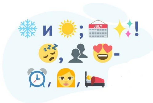
Рис. 7 «Мороз и солнце; день чудесный! Еще ты дремлешь, друг прелестный – Пора, красавица, проснись»

Под данными эмодзи зашифрован отрывок из поэмы А.С.Пушкина «Руслан и Людмила» и стихотворения «Зимнее утро».