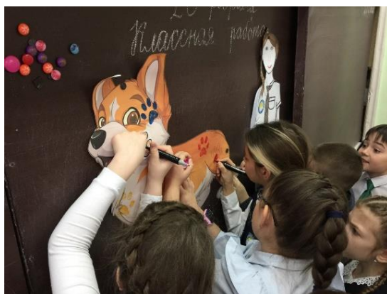
Рис. 3 Рефлексивный этап по уроку «Литературное чтение», тема «Дружба».

Ведь большое внимание Константин Дмитриевич уделял разработке урока, так как правильно подобранная форма занятий, интересные задания, включающие проблемную ситуацию, творческий вид рефлексии и оценивание деятельности не только в формате «Молодец!», но и использование вариантов креативных предложений.