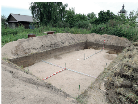
Рис. 7. Археологический раскоп на территории острова-града Свияжск.

Fig. 7. Archaeological excavation in the territory of the island-fort of Sviyazhsk.