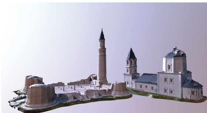
Fig. 12. Three-dimensional model of the Cathedral Mosque of Bolgar fortified settlement.