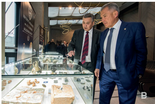
Рис. 11. Посещение Президентом Республики Татарстан Р.Н. Миннихановым временной выставки Института археологии им. А.Х. Халикова АН РТ.