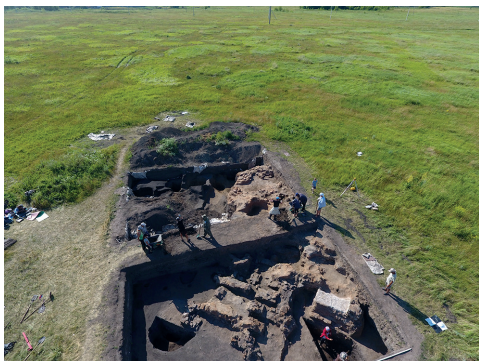
Fig. 6. Archaeological studies of the medieval town of Bilyar in 2018.