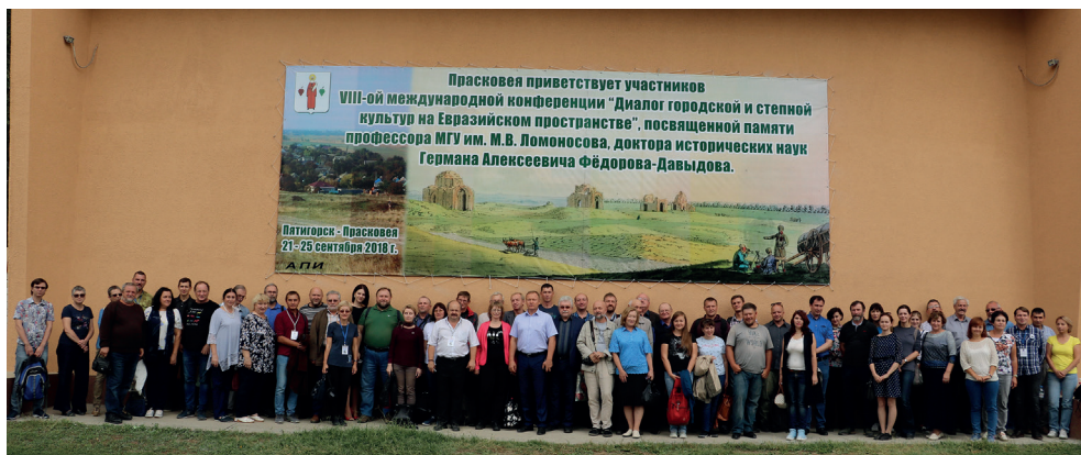
Рис. 1. Общее фото участников VIII Международной научной конференции посвященной памяти Г.А. Федорова-Давыдова «Диалог городской и степной культур на Евразийском пространстве». Прасковья, Ставропольский край, 25 сентября 2018 г.

Fig. 1. Photograph of the participants of the 8 th International Scientific Conference dedicated to the memory of G.A. Fedorov-Davydov “Dialogue of urban and steppe cultures in the Eurasian space”. Praskoveya, Stavropol Krai, September 25, 2018.