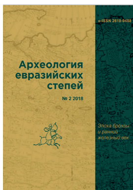
Fig. 9. Cover of the journal “Archaeology of the Eurasian Steppes”.

общим объемом 156,3 а.л., в том числе 30 статей сотрудников Института (Ситдилов, 2018, с. 6–7).