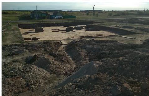
Рис. 5. Археологические исследования на Болгарском городище в 2018 г.

В 2018 г. были продолжены полевые археологические исследования на территории Болгарского городища и в его округе (12 раскопов) (рис. 5), Билярского городища (1 раскоп) (рис. 6) и на острове Свяжск и в его округе (10 раскопов) (рис. 7). Проведенные работы являются важной составляющей формирования целостной системы сохранения историко-культурного наследия и его эффективного использования, включения уникаль-