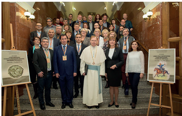
Рис. 2. Общее фото участников IV Международного Мадьярского симпозиума. Казань, Республика Татарстан. 16 октября 2018 г.

Fig. 2. Photograph of the participants of the 4 th International Magyar Symposium. Kazan, Republic of Tatarstan. October 16, 2018