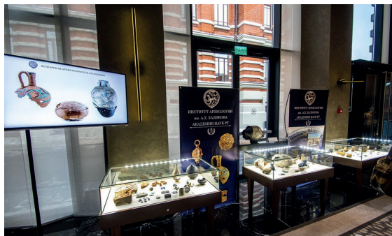
Fig. 10. Temporary exhibition of the Museum of Archaeology of the Republic of Tatarstan under the Institute of Archaeology of the Academy of Sciences.

Татарстана и не представлено в таком масштабе в их экспозициях. Поступления в Научный фонд составили 121 единицу хранения документов научного наследия по археологии, которые составят дополнение к Путеводителю по научному фонду Музея археологии РТ (Садриев, 2017, с. 202–204).