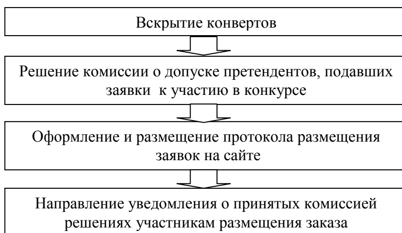
Рис.3 Этап подачи и размещения заявок

Этап подачи и размещения заявок представлен на рис. 3.