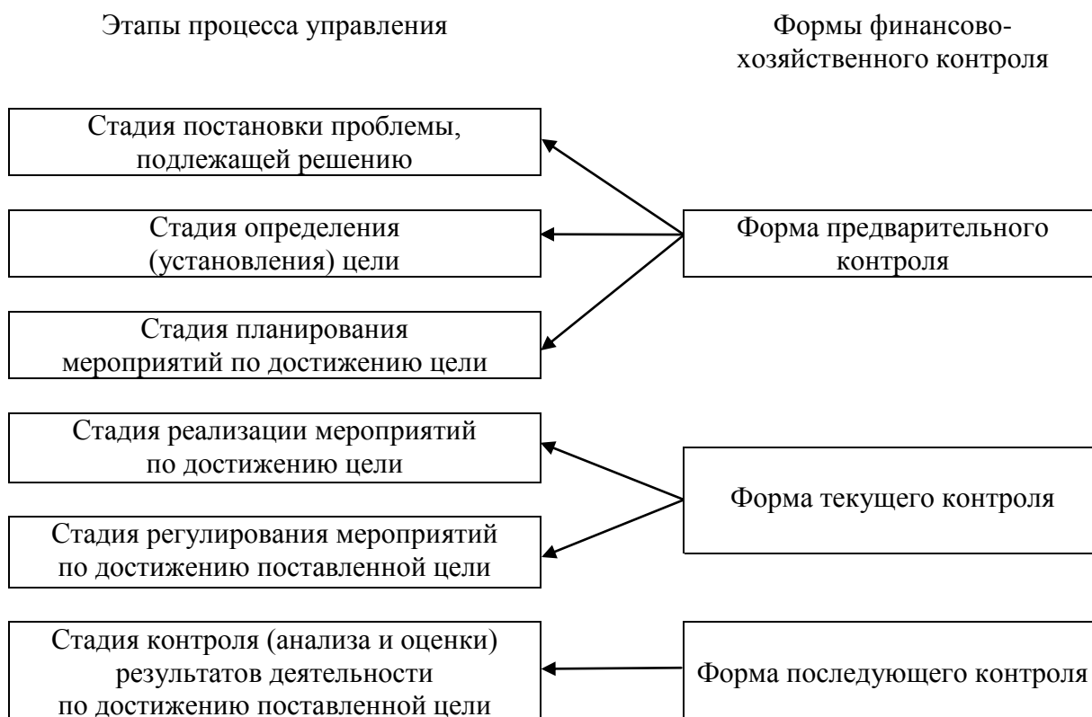
Рис. 1. Применение форм контроля в процессе управления

мостоятельной функций управления, имеющей место на всех стадиях управленческого процесса, а также завершающей стадией всего процесса управления. Можно ли, на Ваш взгляд, дополнить предложенную блок-схему стадий финансово-хозяйственного контроля?