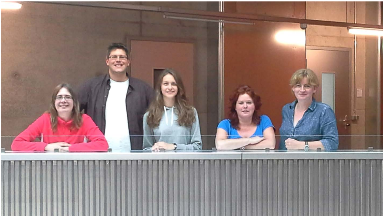
По правую руку от меня - мои научные руководители, по левую – сотрудники лаборатории