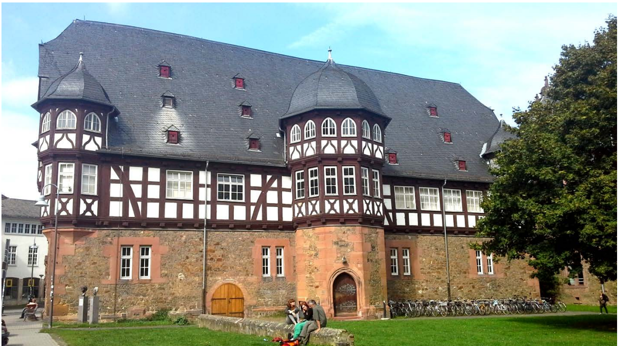
Один из корпусов университета