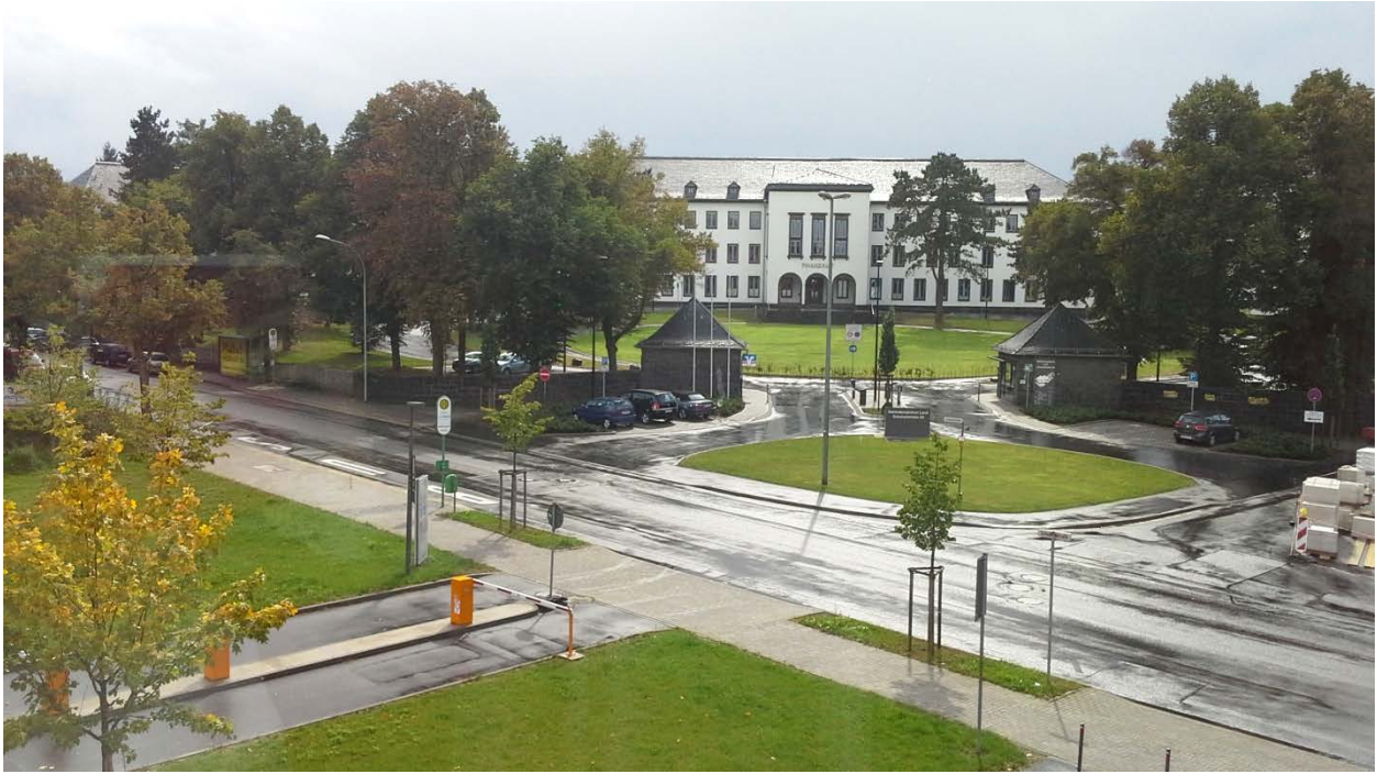
Вид на Финансовый институт из окна лаборатории