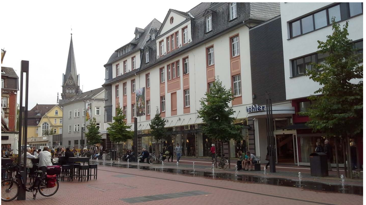
Центр Гиссена. Неподалеку от Marktplatz.