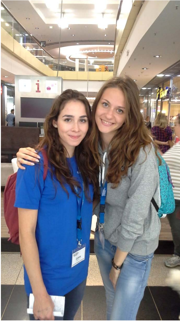
С куратором языковых курсов