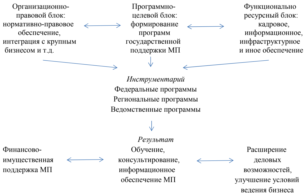
Рис. 1. Пример механизма государственной поддержки субъектов малого предпринимательства

Схематично можно показать иерархию программ государственной поддержки малого предпринимательства. От ведомственных программ выходит расширение деловых связей, финансовая и материально-техническая поддержка малого предпринимательства, обучение и консультация предпринимателей, улучшение условий ведения бизнеса, информационное обеспечение [3, с. 84].