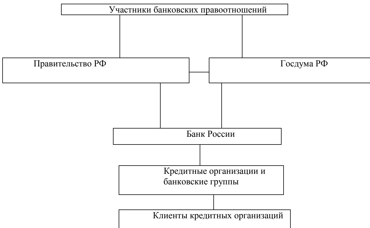
Рисунок 6.2.1. Банковские правоотношения.

Центральный банк по существу является посредником между государством и экономикой. Осуществляя свою деятельность на макроуровне, он отражает общенациональные интересы, проводит политику не в интересах того или иного региона, той или иной группы отраслей народного хозяйства, а в интересах государства в целом.