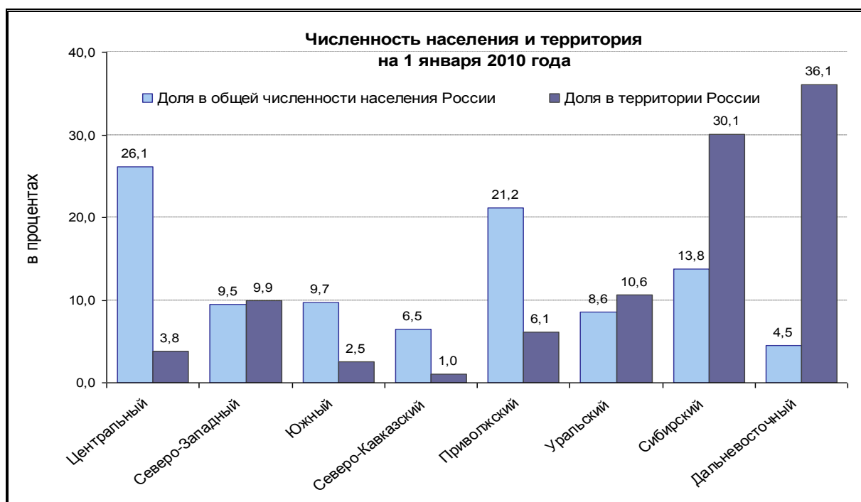
Рис. 1. Доля федеральных округов в общей численности населения и территории Российской Федерации (на 1 января 2010 г.).

4. На основе данных рис.1 проведите ранжировку федеральных округов Российской Федерации по численности населения и территории (отдельно) в порядке увеличения статистических показателей. Провести сравнительный анализ.