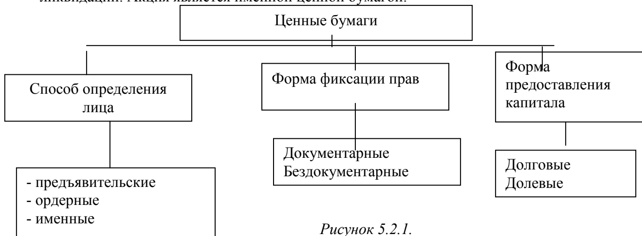
Рисунок 5.2.1. Классификация и значение ценных бумаг.

Акция - эмиссионная ценная бумага, закрепляющая права ее владельца (акционера) на получение части прибыли акционерного общества в виде дивидендов, на участие в управлении акционерным обществом и на часть имущества, остающегося после его ликвидации. Акция является именной ценной бумагой.