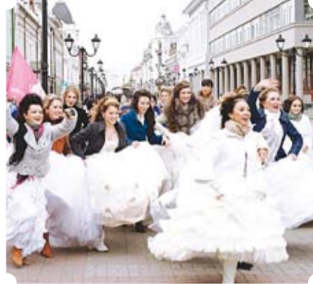
Кәләшләр Бауман урамын да гөрләтте.

Проектның максаты да шул: гайлә тормышын пропагандалау, сизелми дә узып киткән иң бәхетле мизгелләргә тагын бер кат искә төшерергә ярдәм итү. Проектта бары тик кияүдәгә гүзәл затлар гына катнаша ала, ләкин кайчан кияүгә чыккан булу мөһим түгел. Хәтта берничә ел рәттән катнашучылар да бар икән. Кастинг үткәч, катнашучылар финалга эзерләнә башлый. Быел проектка биш ел тулды. Алдагы еллардагы ке-