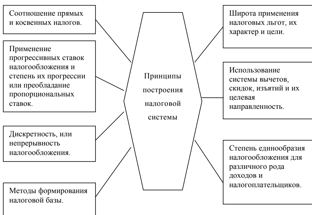
Рис. 2. Принципы построения налоговой системы

Результативность налоговой политики во многом зависит от того, какие принципы государство закладывает в её основу. 3 Основные принципы налоговой системы представлены на рис. 2.